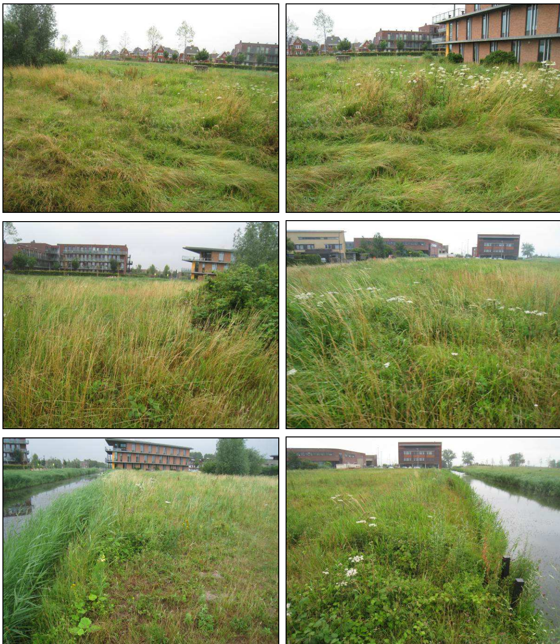
Figuur 2. Foto-impressie van het plangebied aan de Floridalaan te IJsselstein.