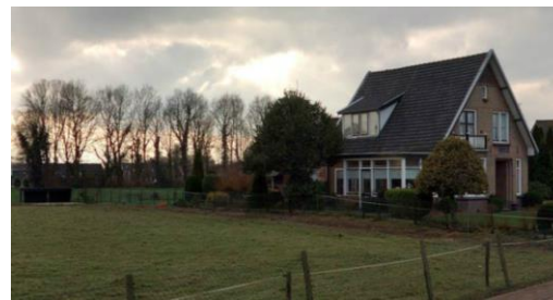
Boven: Stationsweg Oost 122 Onder: Stationsweg Oost 126

Conclusie: deze zienswijze geeft aanleiding het bestemmingsplan aan te passen.