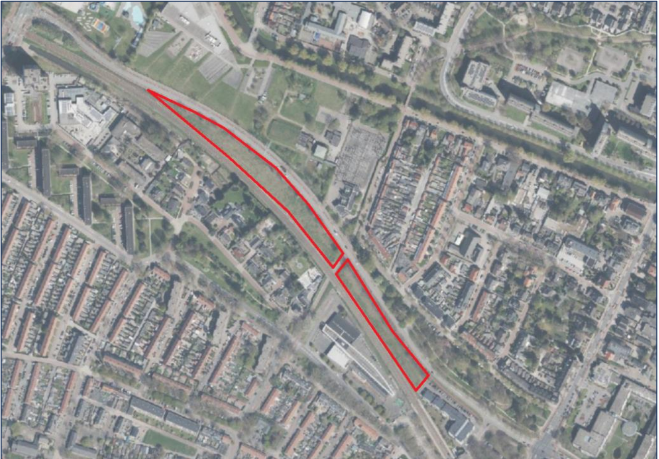
Afbeelding 1.2: Luchtfoto van het projectgebied (binnen het rode kader).