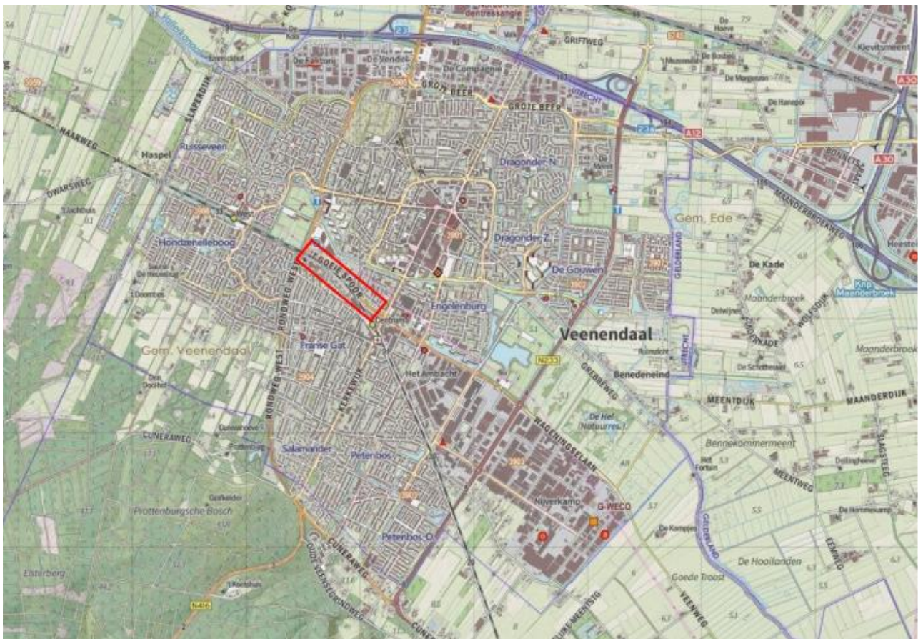
Afbeelding 1.1: Ligging van het projectgebied (Rood kader).

Het projectgebied heeft een oppervlakte van ca. 1,3 ha, en bestaat uit twee groene stroken gescheiden door een fietspad dat onder de spoorweg en 't Goeie Spoor loopt (Afb. 1.3).