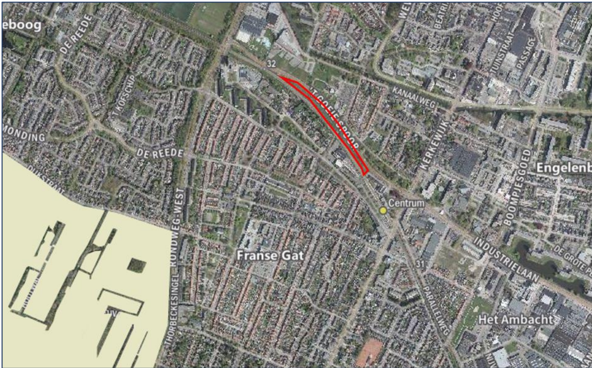
Afbeelding 4.2: Ligging van het projectgebied (rood kader) ten opzichte van het Natuurnetwerk Nederland (wit).