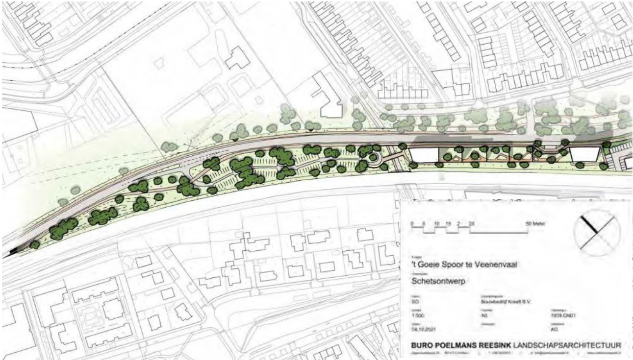
Plattegrond schetsontwerp 't Goeie Spoor te Veenendaal door Buro Poelmans Reesink landschapsarchitectuur.