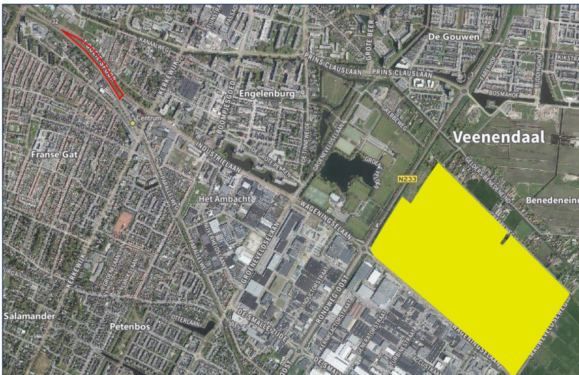
Afbeelding 4.1: Ligging van het projectgebied (rood kader) t.o.v. Natura 2000-gebied (geel).

Het projectgebied is niet direct zichtbaar vanuit omliggende Natura 2000-gebieden. Van optische verstoring van soorten in Natura 2000-gebieden is derhalve geen sprake. Gelet op de ligging van het projectgebied en de beperkte impact van de ingreep, kan verstoring van soorten in Natura 2000-gebieden door licht en geluid op voorhand worden uitgesloten. Een substantieel, negatief effect van de voorgenomen ontwikkeling op de stikstofemissie en daarmee op Natura 2000-gebieden is niet aannemelijk, en is nader onderzocht middels een AERIUS berekening. Er is geen sprake van significante gevolgen voor Natura 2000-gebieden, het aanvragen van een vergunning op grond van de Wet natuurbescherming is niet aan de orde.