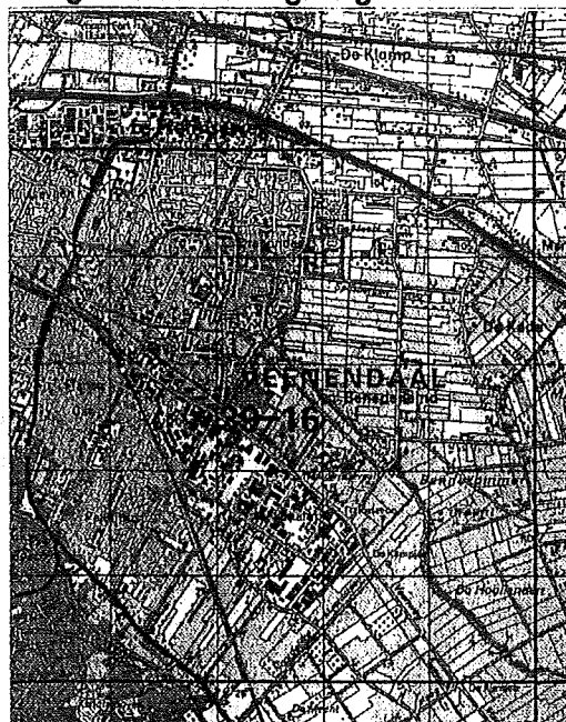
Plangebied in z'n omgeving.

In deze rapportage zijn de resultaten verwoord van de ecologische quickscan van het plangebied. Van het plangebied is een beknopte situatiebeschrijving opgenomen. Daarna zijn, per soortengroep, de aangetroffen en de verwachte beschermde soorten aangegeven. Ook is aangegeven welke van deze soorten door de ingreep ter plaatse mogelijk zullen worden verstoord en voor welke soorten derhalve een ontheffing in het kader van de Flora- en faunawet vereist is. Bij de toetsing is uitgegaan van de Algemene Maatregel van Bestuur, welke op 23 februari 2005 van kracht is geworden.