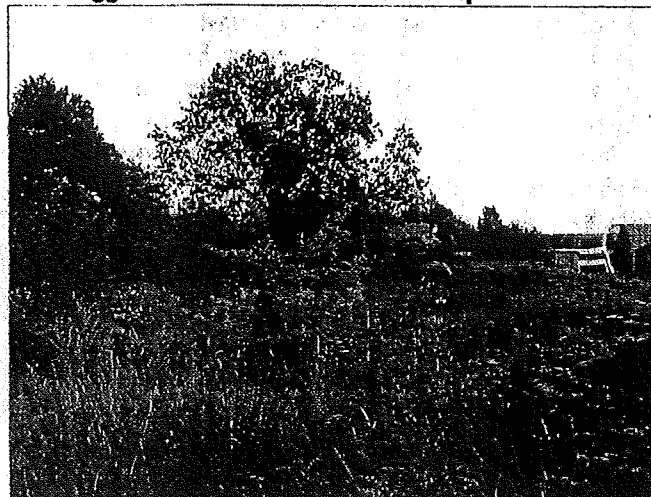
Braakliggend deel van volkstuinencomplex.

De rest van het volkstuinencomplex dat binnen het plangebied ligt is nu nog deels in gebruik en is deel recent uit gebruik genomen. Op dit terreindeel zijn naast de aangeplante gewassen vooral pio-