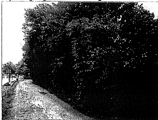
Beplanting langs de 1 e Melmseweg.

Een deel van het volkstuinencomplex is circa 3 jaar geleden braak komen te liggen. Op dit terreindeel heeft zich inmiddels een soortenrijke ruigte met soorten als Rietgras, Pitrus, Jakobskruid, Boerenwormkruid, Peen en Knoopkruid gevestigd. Hier staan ook verschillende uit (volks)tuinen verwilderde soorten zoals Herfstmunt, Aalbes en Wilde marjolien. Verspreid staat opslag van onder andere Ruwe berk, Wilde lijsterbes, Zomereik en Gewone braam. Op enkele plaatsen ligt wat grof vuil.