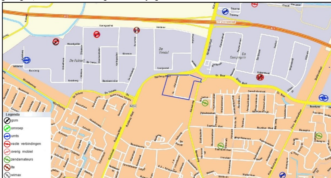
Afbeelding 2: Uitsnede kaart Antenneregister

Op basis van de gegevens uit het Antenneregister blijkt dat er in de omgeving van het plangebied geen gsm, umts of andersoortige masten zijn gesitueerd.