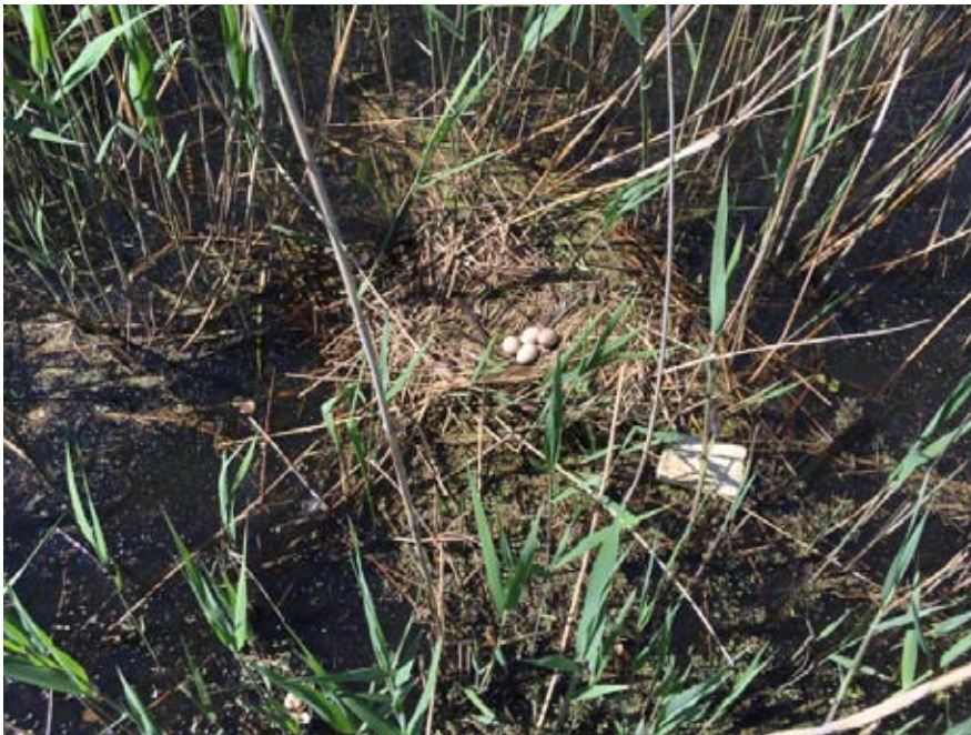
Figuur 2. Meerkoetennest in te dempen sloot.

In de sloten kwam nauwelijks vis voor, in het westelijke deel is geheel geen vis gevangen. Met lage aantallen waren Driedoornige en Tiendoornige stekelbaars aanwezig. Beide soorten zijn onbeschermd. Kleine modderkruiper en Grote modderkruiper zijn niet aangetroffen. Verder zijn enkele groene kikkers waargenomen met kenmerken van Bastaardkikker. Deze soort is licht beschermd in de Wet natuurbescherming. Er geldt voor Bastaardkikker een algemene ontheffing in geval van ruimtelijke ontwikkelingen. In en rond de sloten zijn een nest en enkele territoria van vogels vastgesteld (fig. 1). Het ging om twee meerkoetennesten (fig. 2), een territoria van Scholekster en zangposten van een Rietgors, Grasmus en Bosrietzanger. Het is mogelijk dat het aantal vogelterritoria de komende weken nog toeneemt, met name in de delen met ruigte en opgaande begroeiing.