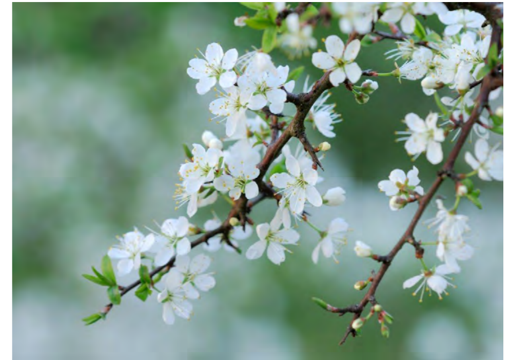
SLEEDOORN 5 pt Aanplanten van sleedoorn in tuinen en erven.