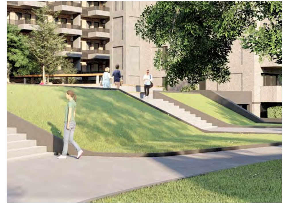
TEGEL VERVANGEN DOOR GROEN 20 pt Deels vervanging van bestrating door inheems groen. Op vele plekken wordt er tussen de wandelpaden en rijbaan groen aangebracht. (gras en struiken)