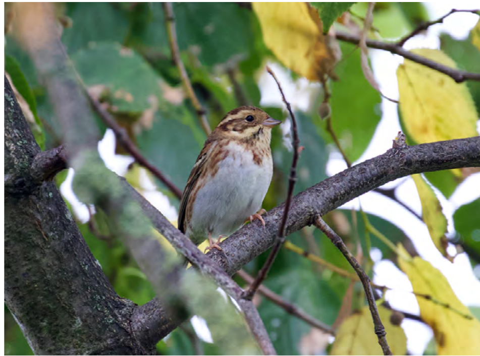
KWETTERBOSJE HUISMUS 2 pt Bosje van dichte groenblijvende struiken in een tuin of erf als schuilplaats en slaappleatse plevier