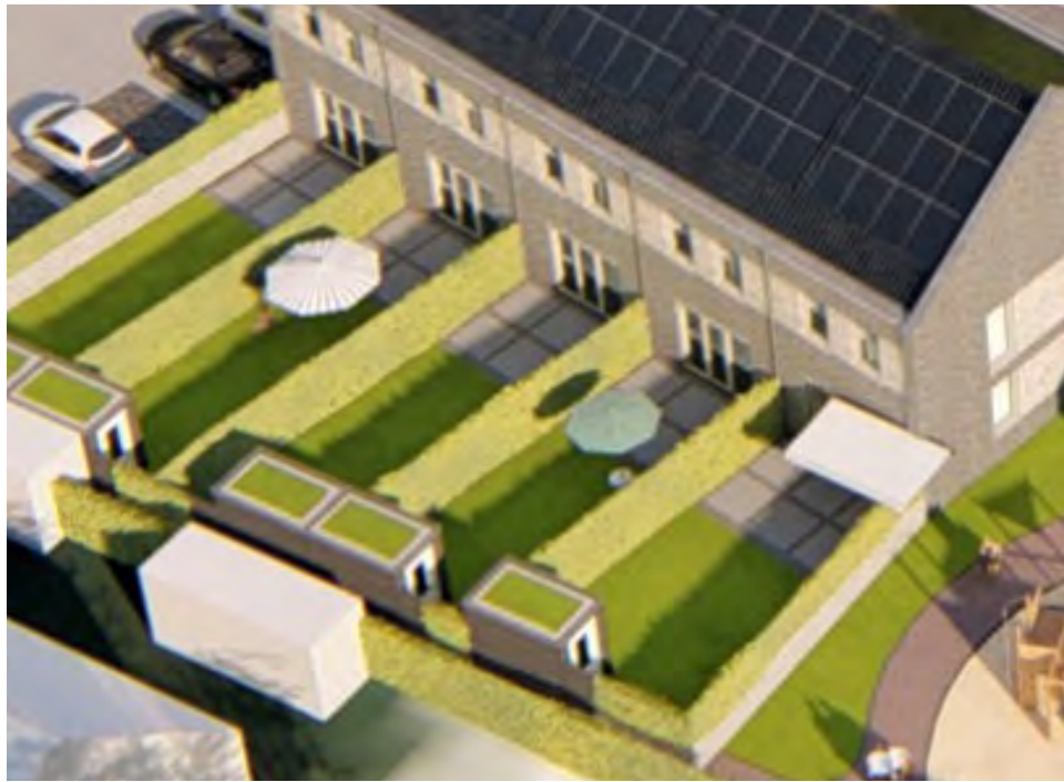
SCHUTTING ERUIT, HAAG ERIN 32 pt max. 2 pt per erfafscheiding (16 erfafscheidingen) Het vervangen van een 'harde' erfafscheiding door een groene haag. In de tuinen van de grondgebondenwoningen komt een groene haag.