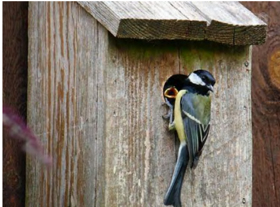
MEZENKAST 1 pt Ophangen van mezenkasten aan bomen in tuinen of erven.