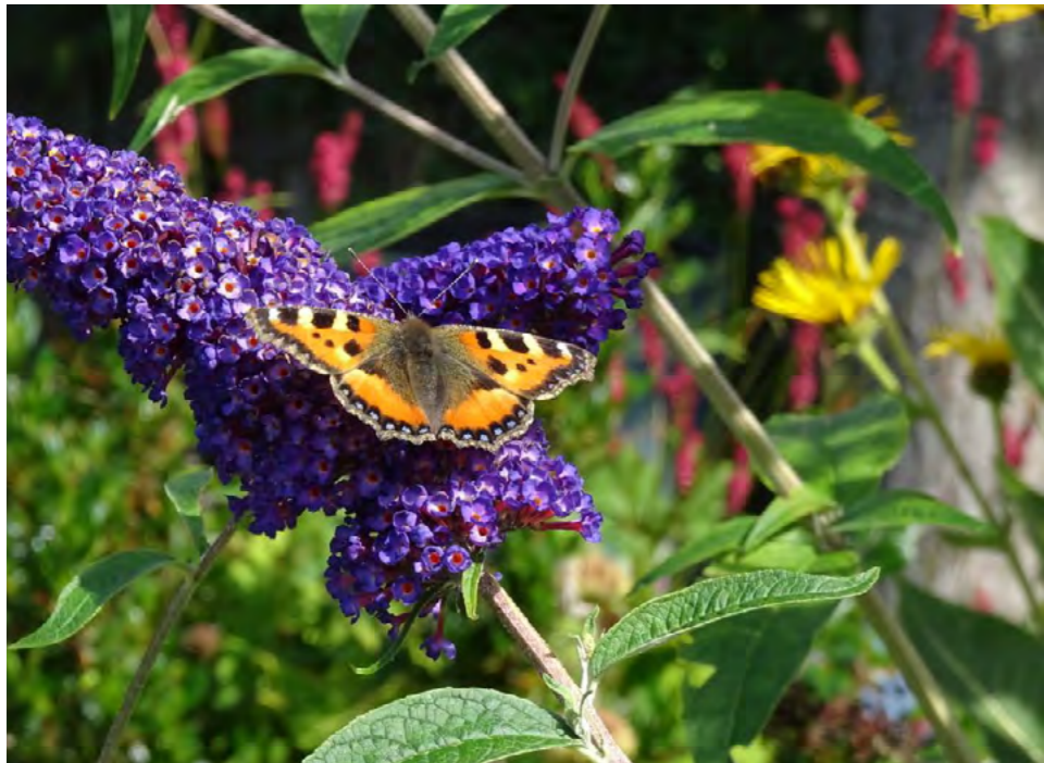
AANPLANT INSECTVRIENDELIJKE STRUIK 5pt Aanplant van vlinderstruik, Gelderse roos, meidoorn of sporkehout. (vuilboom)