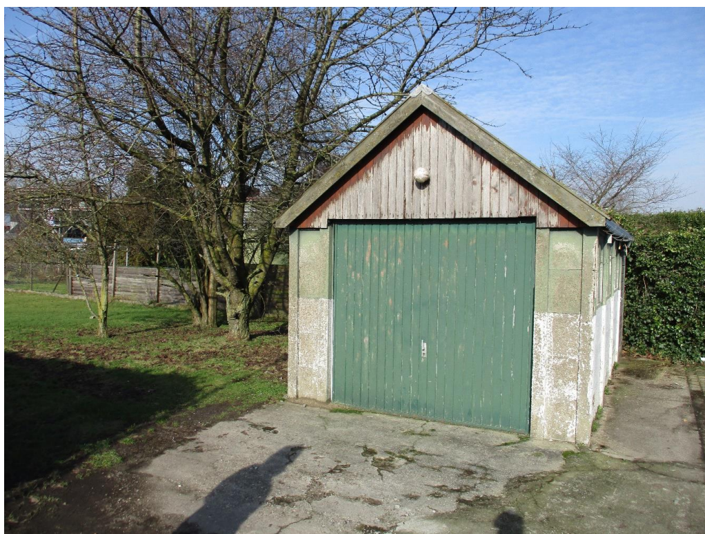
Figuur 2 De derde schuur, opgetrokken uit betonplaten en zadeldak met damwandplaten.