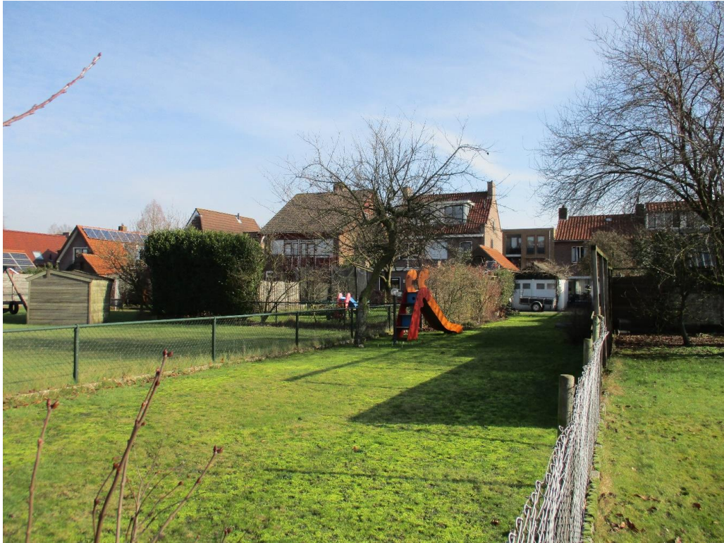
Figuur 3 De tuinen bestaan grotendeels uit gazons.