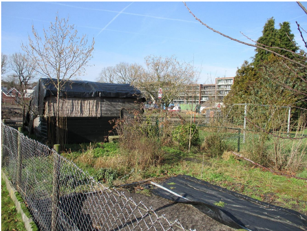
Figuur 4 In één van de tuinen is een moestuin aanwezig.