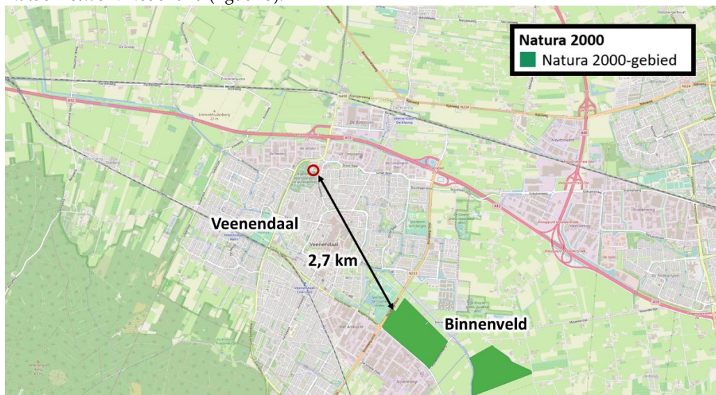
Figuur 2 De planlocatie ligt op een afstand van 2,7 km tot het Natura 2000-gebied Binnenveld.

De planlocatie maakt geen deel uit van een beschermd gebied en/of locatie betreffende Natura 2000 of het Natuurnetwerk Nederland. Op een afstand van 2,7 km ligt het Natura 2000-gebied Binnenveld (figuur 2). De planlocatie ligt op een afstand van circa 1 km ten noorden van het Natuurnetwerk Nederland (figuur 3).