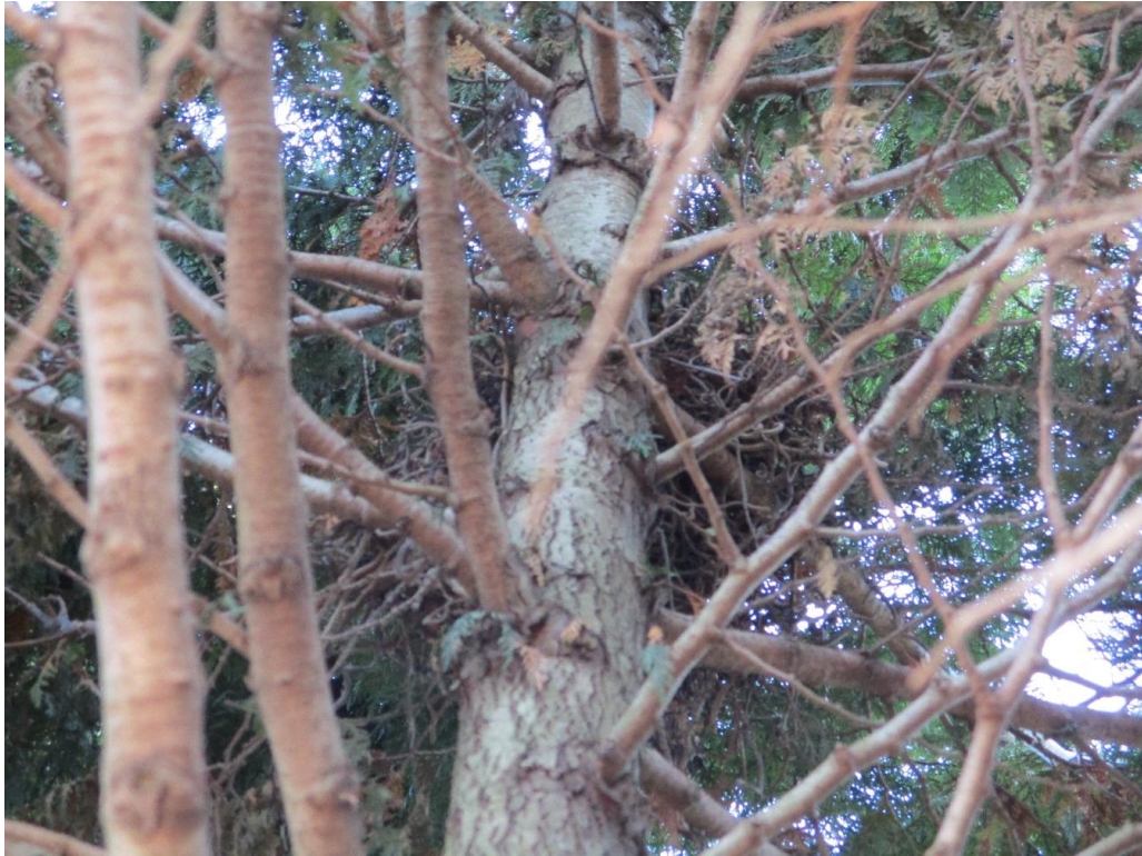
Figuur 4 In de conifeer in de tuin van Nieuweweg 213 is een nest van een houtduif aanwezig. Deze boom dient derhalve buiten het broedseizoen te worden gekapt.