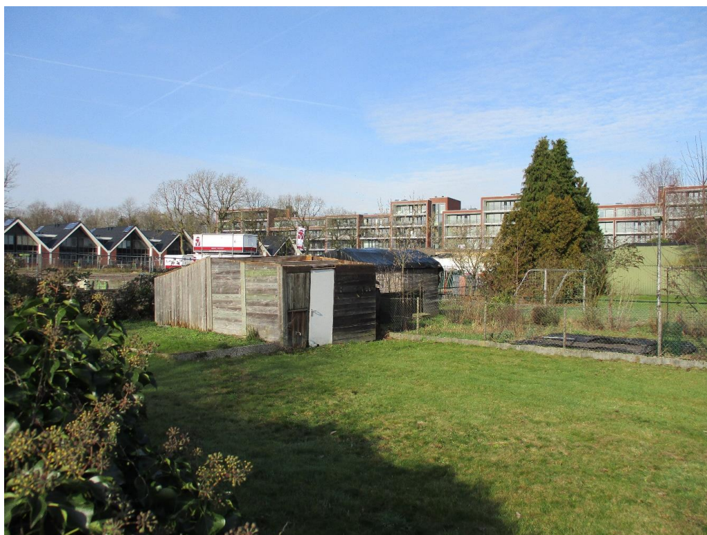
Figuur 1 De planlocatie is gelegen aan de Nieuweweg 207 t/m 213 en bestaat uit tuinen met daarop drie schuren. Op bovenstaande afbeelding zijn de twee houten schuren zonder dak afgebeeld.