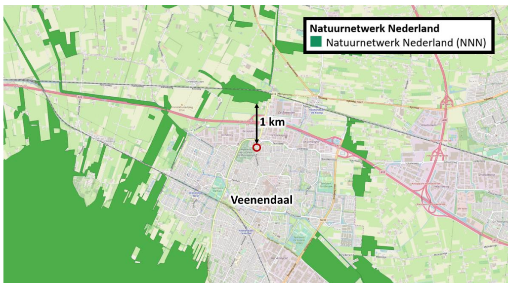
Figuur 3 De planlocatie ligt op een afstand van circa 1 km tot het Natuurnetwerk Nederland (bron: nationaal Georegister PDOK).