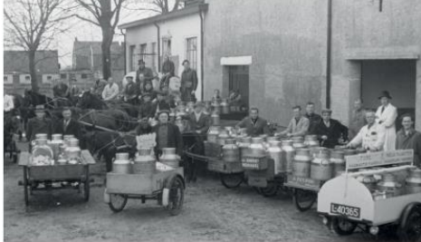
Veenendaalse Melkinnrichting en Zuivelfabriek - tot 1975