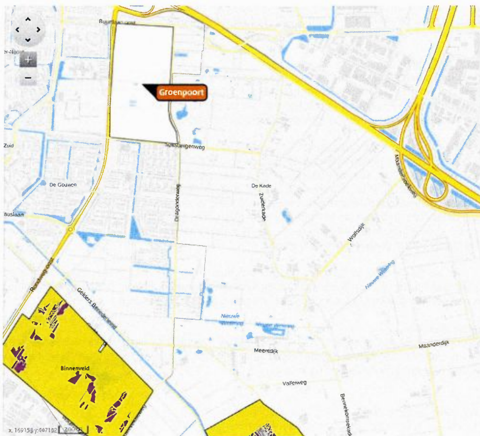
Figuur 2 Ligging plangebied Groenpoort ten opzichte van het Natura 2000-gebied Binnenveld.