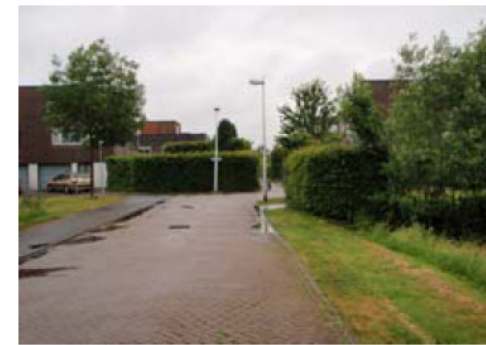
Hoek Slingeraklaan - Gouderaklaan

Ontvangen van gemeente Utrecht Door RH aangevuld