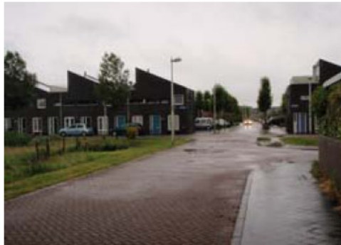
Hoek Slingeraklaan - Houtrakgracht