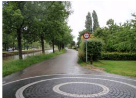
Hoek Zandweg - Gouderaklaan