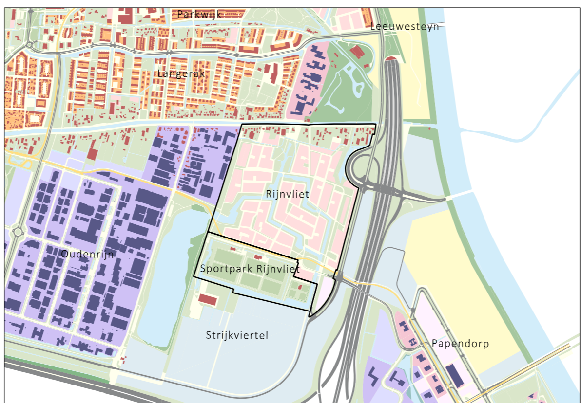
Rijnvliet en omgeving

AAN DEZE TEKENING KUNNEN GEEN RECHTEN WORDEN ONTLEEND