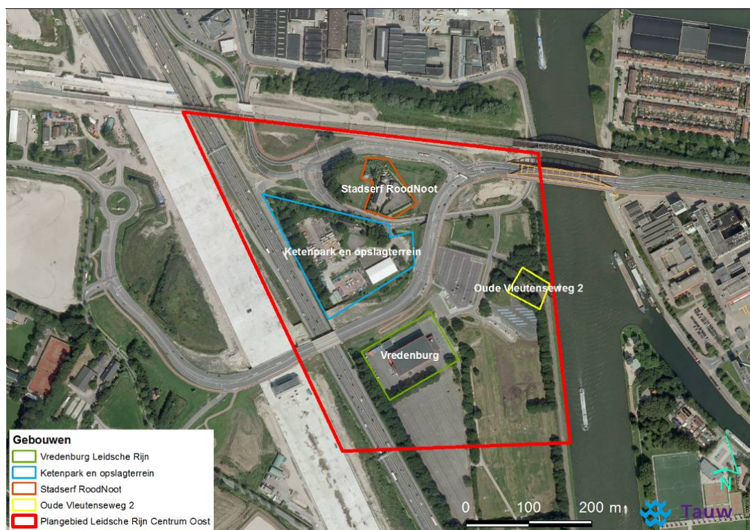
Figuur 1.1 Globale ligging van het plangebied (rode contour)

Op dit moment vinden er al volop (bouw)werkzaamheden plaats in Leidsche Rijn Centrum. Aan de westkant van de A2-kap is onder andere gestart met de bouw van het kernwinkelgebied. Aan de Oostkant is gestart met de bouw van de bioscoop. In het voorjaar van 2015 is het Berlijnplein (plein op de A2 tunnel) aangelegd.