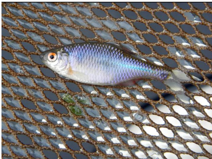
Figuur 3.2 één van de gevangen bittervoorns