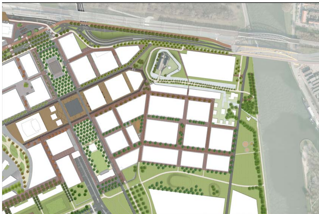
Figuur 1.2 Beoogde ontwikkeling in kaart