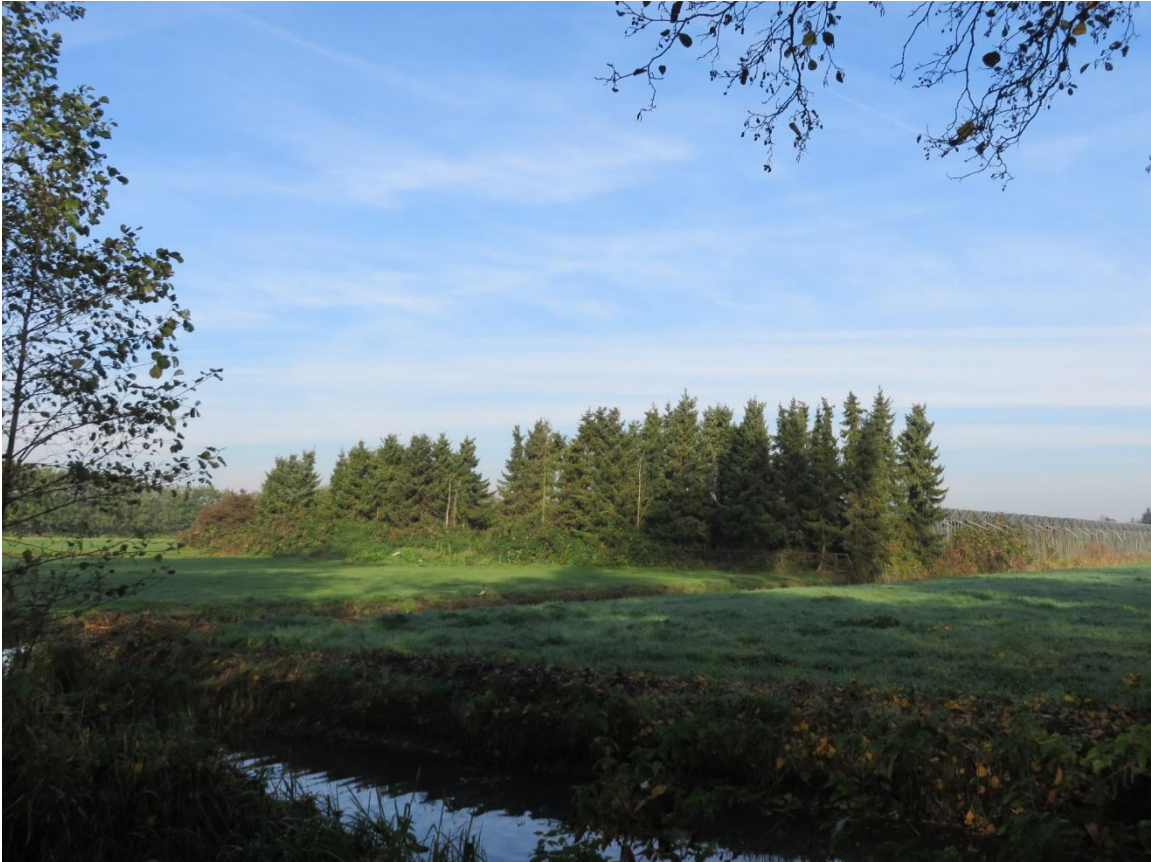
Douglassparren (Vak A)