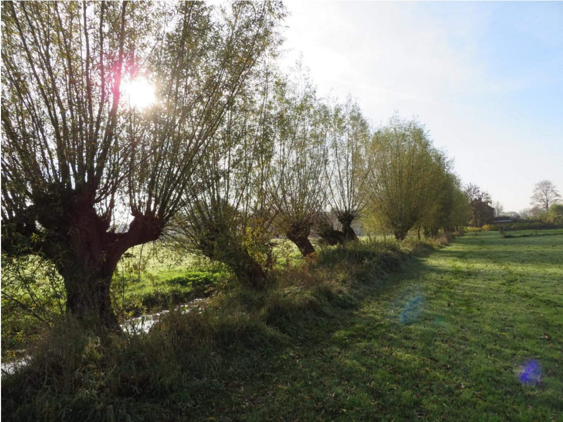
Knotwilgen (boomnr. 1 t/m 22)