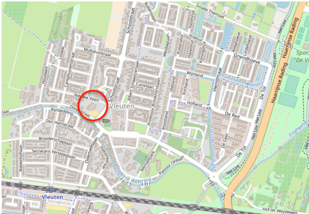
Figuur 1 Ligging plangebied (rood omcirkeld) Dorpsplein te Vleuten (ondergrond: Data by OpenStreetMap.org contributors under CC BY-SA 2.0 license).

bestaat uit twee bouwlagen met een plat dak. Het zuidelijke deel (ruimtes 10 t/m 14 en 42 t/m 53) gelegen aan de Dorpsstraat zal worden gesloopt (figuur 2). De gevels zijn hier opgetrokken uit baksteen en strak afgewerkt. Er zijn geen open stootvoegen of dilatatievoegen aanwezig (foto 2).