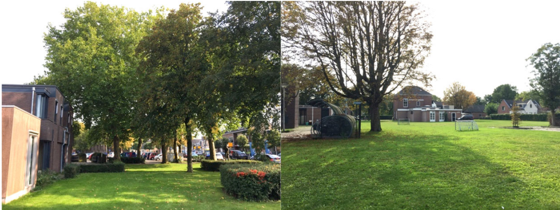
Foto 3, 4 Het groen rondom het Wijkservicecentrum, bestaat uit bomen, lage hagen en gazon.