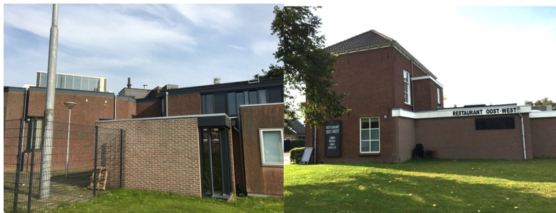
Foto 7 Lage aanbouw aan het Wijkservicecentrum. Foto 8 Restaurant Oost-West.