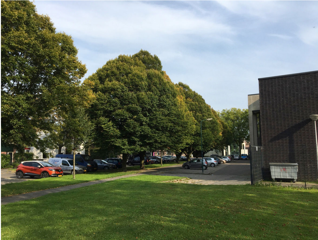
Foto 1 Noordzijde van het Wijkservicecentrum met parkeerplaatsen, gazon en bomen.