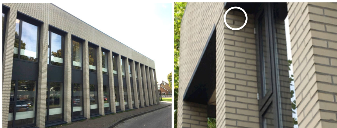
Foto 5,6 De noordkant van het Wijkservicecentrum, met aan de bovenzijde open voegen (cirkel rechts).

Aansluitend aan het gazon rondom het Wijkservicecentrum ligt het Restaurant Oost-West (foto 8). Dit gebouw is voorzien van een schuin pannendak met een houten sieromlijsting. In de gevel van het oude deel zijn geen open voegen gezien, in de lage nieuwere aanbouw zijn deze wel aanwezig. Tevens bevat dit deel een houten omlijsting rondom het dak. Bij zowel het dak van het oude deel als de aanbouw kan aanwezigheid van verblijfplaatsen van vleermuizen niet worden uitgesloten.