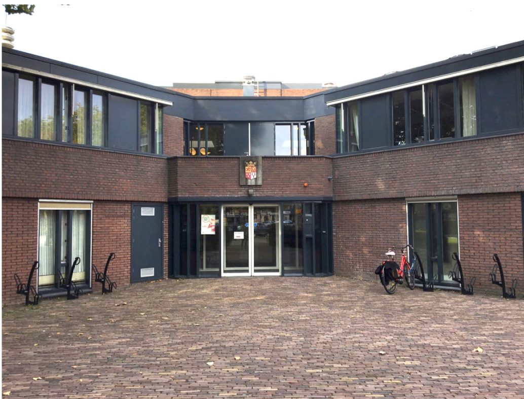
Foto 2 Gevel van het te slopen deel van het Wijkservicecentrum.