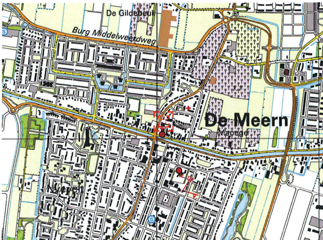
Figuur 1: Ligging plangebied in de omgeving

In het kader van het Besluit externe veiligheid inrichtingen en de Circulaire Risiconormering vervoer gevaarlijke stoffen is het voornemen beoordeeld. Figuur 1 toont het plangebied.