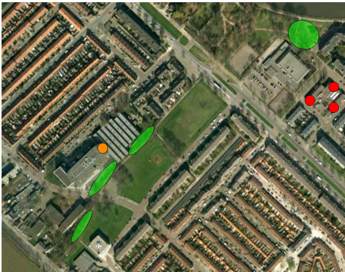
Figuur 1. Gebiedsgebruik van de gewone dwergvleermuis. groen: belangrijk foerageergebied; rood: locatie kraamverblijf; oranje: (vermoedelijke) locatie paarverblijf.

Van de watervleermuis zijn geen verblijfplaatsen in het plangebied vastgesteld. Boven de Vecht zijn op 9 juli en 5 augustus enkele foeragerende exemplaren waargenomen. Deze dieren zijn mogelijk afkomstig van kolonies in de buurt van Oud Zuilen of andere landgoederen langs de Vecht.