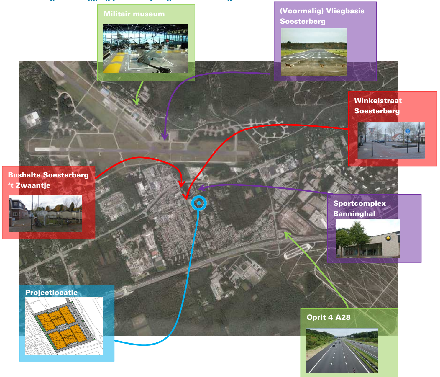
Figuur 1: Ligging plan Kampweg in Soesterberg