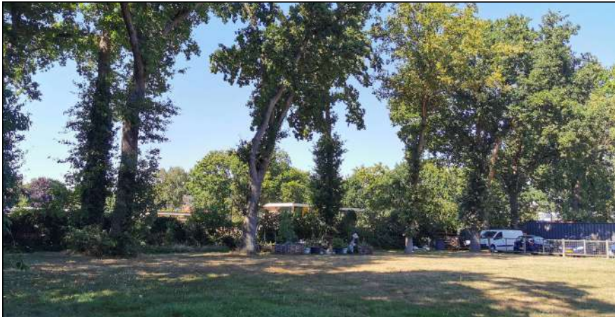
Figuur: de bomenrij aan de oostzijde van het plangebied kan een essentiële vliegroute vormen voor vleermuizen, zoals dwergvleermuizen en franjestaart.