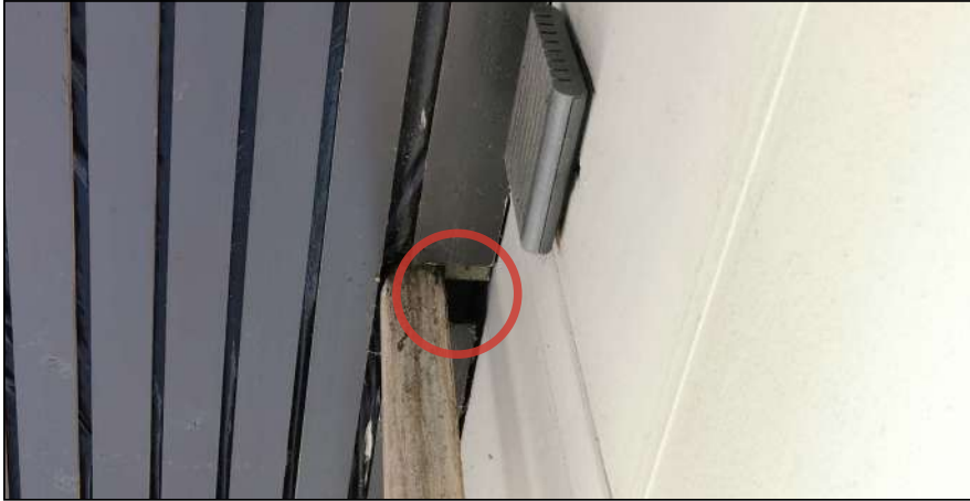
Figuur: in het dak van het woonzorgcomplex zijn diverse invliegopeningen aangetroffen die geschikt zijn voor huismus en vleermuizen.