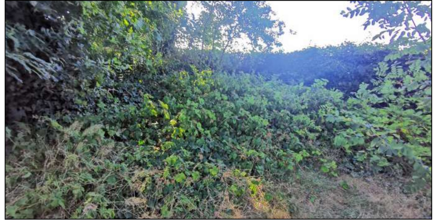
Figuur: het struweel kan essentieel leefgebied en verblijfplaatsen herbergen van de hazelworm.