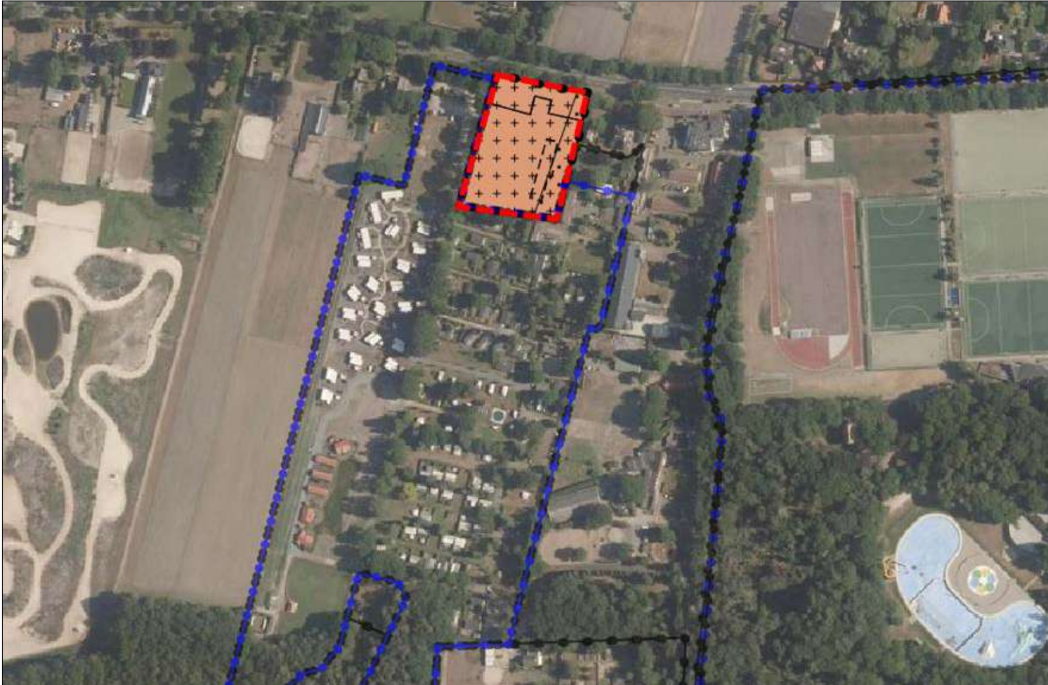
Figuur: kaart plangebied zoals aangeleverd door de opdrachtgever.