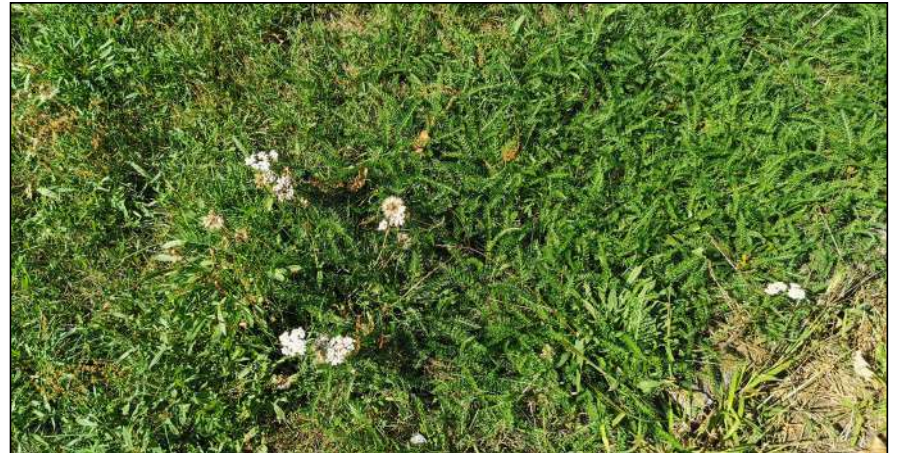
Figuur: plantensoorten zoals duizendblad en schapenzuring duiden op droge, matig voedselrijke omstandigheden, dit vormt geschikt biotoop voor glad biggenkruid.