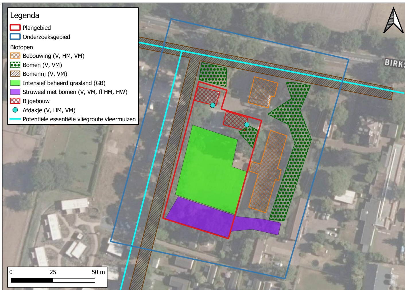
Figuur 3: kaart met weergave van relevante waarnemingen en biotopen. Zie Tabel 2 op de vorige bladzijde voor de effectbeoordeling (PDOK, 2022).

Gebruikte afkortingen: V = vogels zonder jaarrond beschermd nest, VM = vleermuizen, HM = huismus, GB = glad biggenkruid, HW = hazelworm, fl = essentiële functionele leefomgeving.