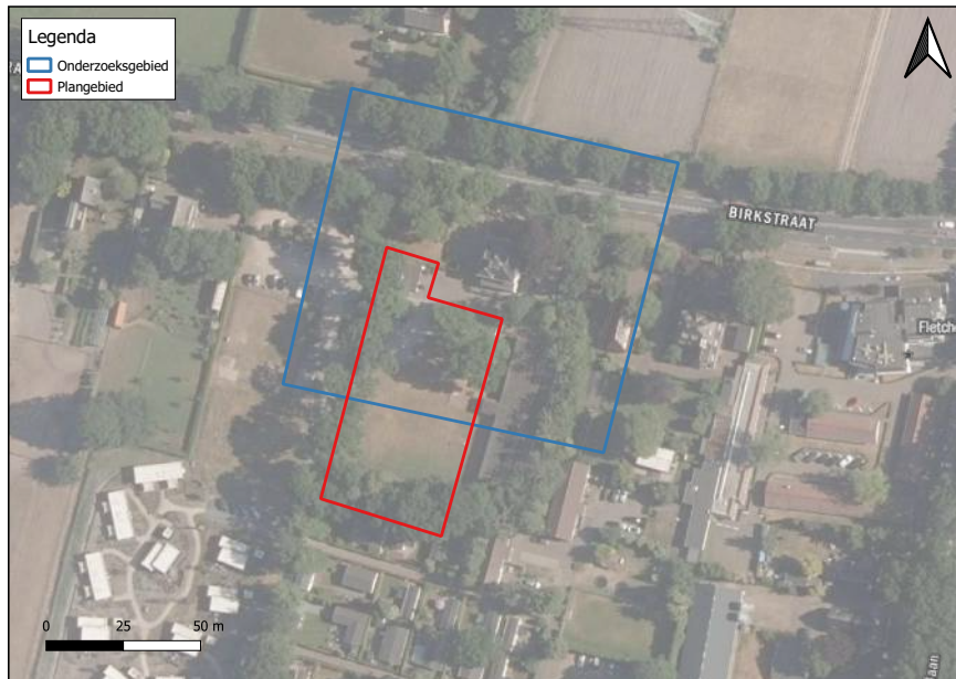
Figuur 1: het plangebied is rood omrand en het onderzoeksgebied is blauw omrand (PDOK, 2022).

De omgeving van het plangebied bestaat uit grasland, bomen, wegen en bebouwing. De werkzaamheden beperken zich tot het perceel dat de bestemming 'Maatschappelijk' heeft. Er wordt geen bebouwing gesloopt.