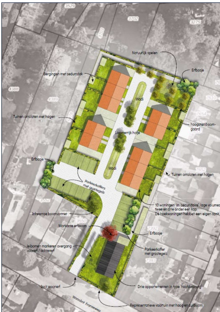
Afbeelding 2.4. Schets toekomstige situatie.

De initiatiefnemer is voornemens de bestaande woning met achterliggende garageboxen te slopen. Er worden 10 grondgebonden woningen en 3 appartementen met parkeergelegenheid gerealiseerd (Afbeelding 2.4). Het binnenterrein wordt ingericht met enkele 2- en 3-onder-een-kapwoningen (10 wooneenheden) met centraal een gemeenschappelijk hofje. Het hofje wordt groen ingericht met gazon, wadi, landelijke hagen, erfboomen en fruitbomen. De groenstructuren worden ingevuld met klimaatbestendige beplanting. Door de wadi's midden in het hofje te plaatsen en te combineren met het gazon zorgen deze open plekken voor snelle afwatering met een korte afstand tussen woning en wadi. Noordoostelijk in het plangebied is de ruimte ingericht met een kleinschalige hoogstamboomgaard met een natuurlijke speelplek. Ten behoeve van het kleinschalige karakter zijn overhoekjes in het plangebied op speelse wijze ingevuld als erfbosjes met gemengd inheems bosplantsoen. Ten behoeve van de biodiversiteit is gekozen voor overwegend vruchtdragende soorten als hazelaar, meidoorn, sleedoorn en Gelderse roos (Ontwerpbureau Luijendijk, 2023).