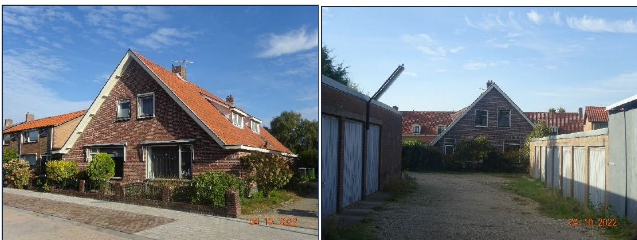
Afbeelding 2.3. Impressie projectgebied.