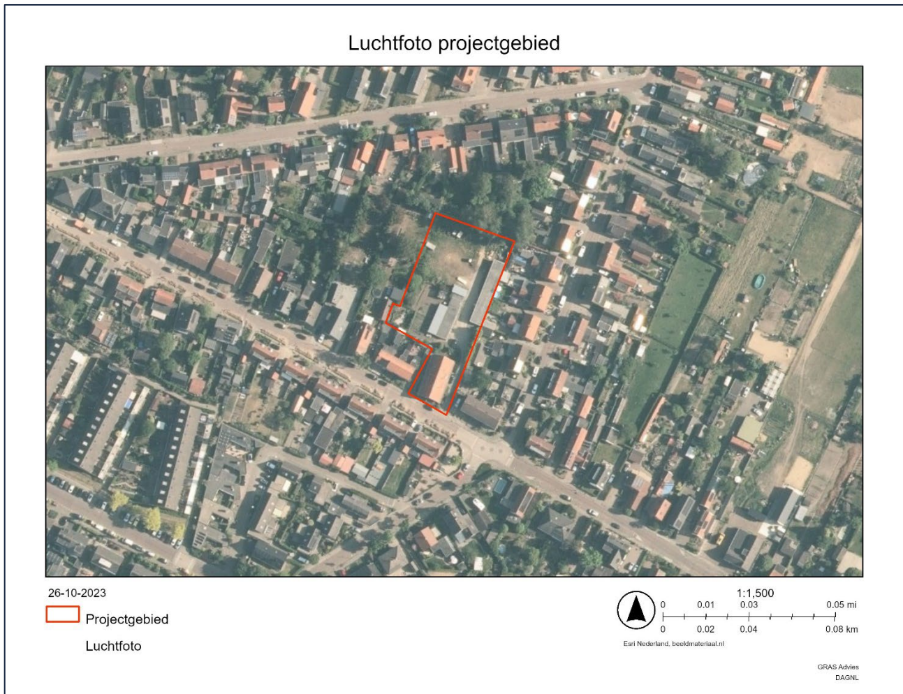
Afbeelding 2.2: Luchtfoto met begrenzing van het projectgebied (rood kader).

1932. Verder zijn er op het terrein garageboxen aanwezig met een bouwjaar omstreeks 1972. Deze garageboxen hebben een plat dak en slechts één verdieping. Het dak van het woonhuis bestaat uit een zadeldak met dakpannen met aan de oostzijde een dakkapel. Afbeelding 2.3 geeft een impressie van het projectgebied.