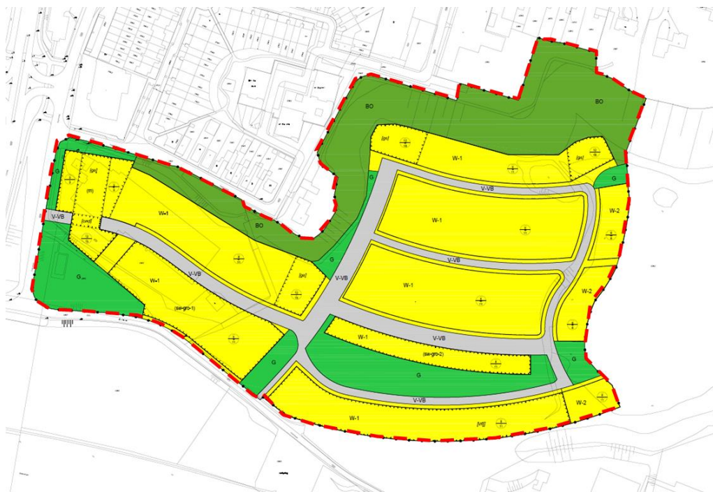
Verbeelding vigerend bestemmingsplan Rhenen, Vogelenzang

Hierna is een uitsnede van de verbeelding van dit bestemmingsplan opgenomen.