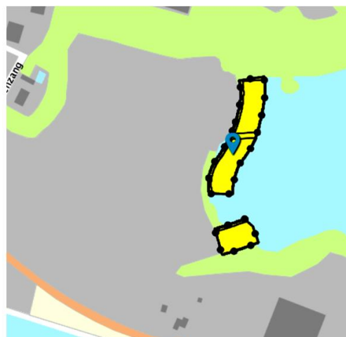
Verbeelding BP 'Oeverwoningen'