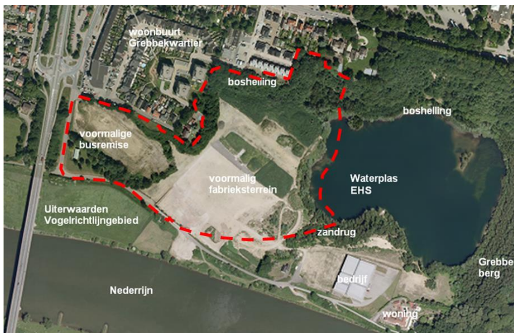
Ligging van het plangebied in omgeving met globale aanduiding plangebied

Het plangebied omvat het gehele plangebied van de nieuwe wijk Vogelenzang. Hieronder is een kaart opgenomen van dit gebied.