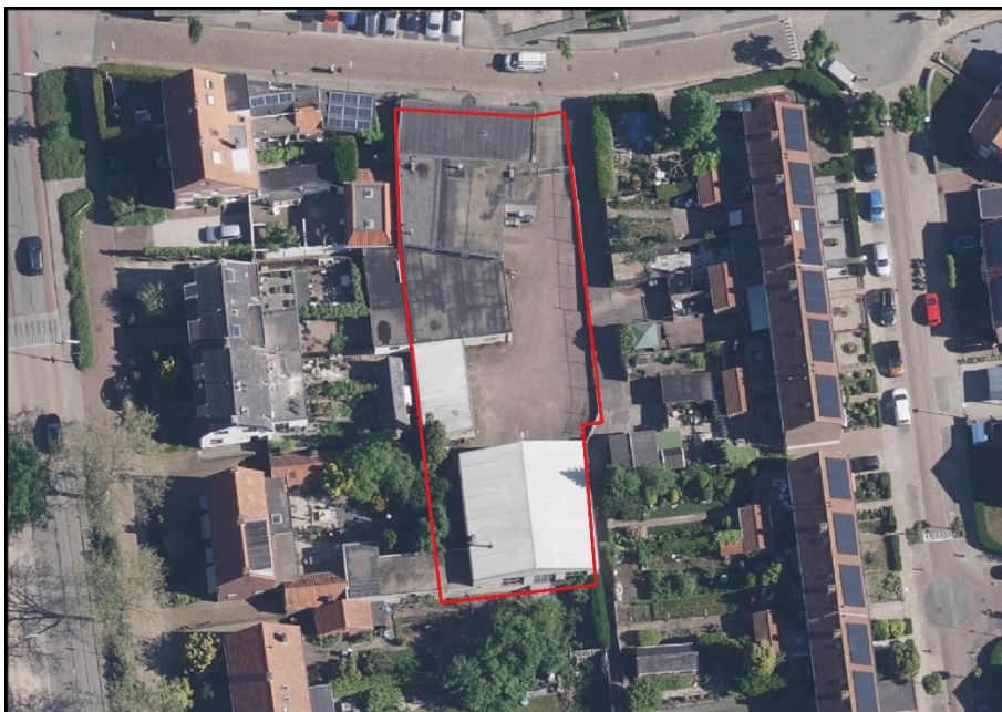
Figuur 2.2: Impressie van het plangebied.

Het plangebied omvat een voormalige garage, garageboxen, opslag, bebouwing en erfverharding. De daken van de gebouwen bestaan uit plat dak of golfplaten. De muren bestaan deels uit gemetselde delen en golfplaten/damwand delen.