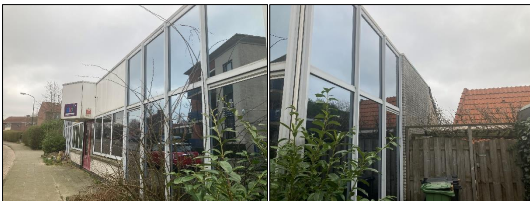
Figuur 2.3 (links): De oostzijde van het plangebied. Hier is begroeiing in de vorm van struiken aanwezig; Figuur 2.4 (rechts): De zuidzijde van de bebouwing grenst aan tuinen. De muren bevatten geen stootvoegen.