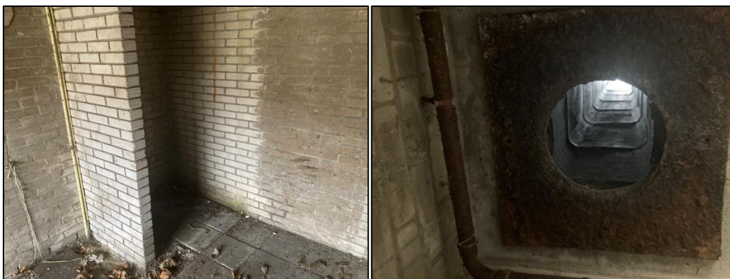
Figuur 2.9 (links): Onderaan de schoorsteen liggen bladeren; Figuur 2.10 (rechts): De binnenkant van de schoorsteen.