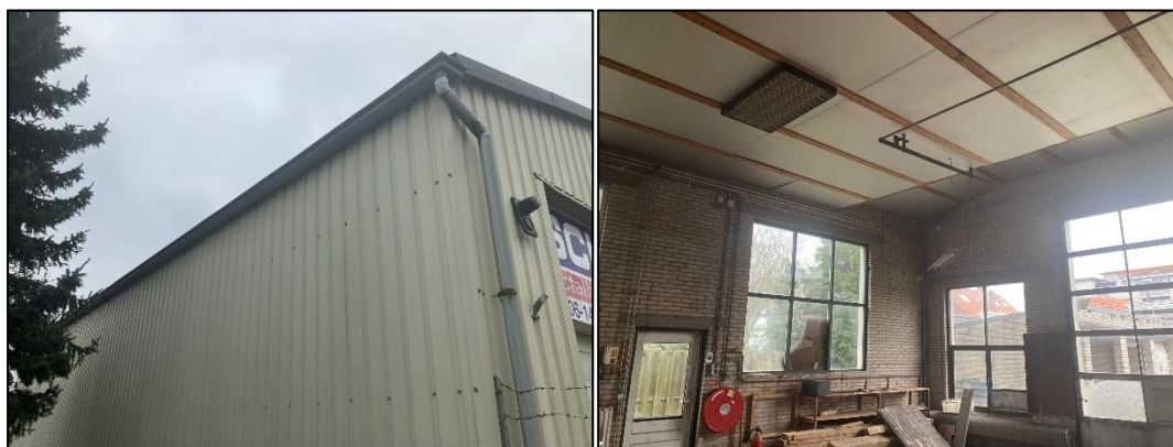
Figuur 2.13 (links): De noordzijde van de garage bestaat uit damwand. Langs de bovenzijde loopt een dakgoot; Figuur 2.14 (rechts): De binnenzijde van de garage.