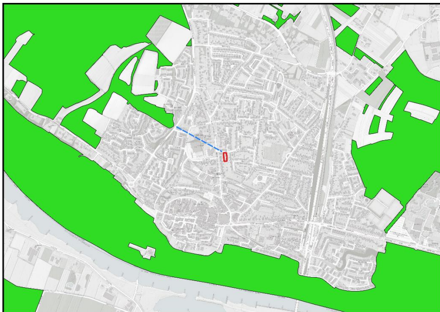
Figuur 5.2: Ligging van Natuurnetwerk Nederland in de omgeving van het plangebied. De ligging van het plangebied wordt met de rode marker aangeduid. Gronden die tot NNN behoren worden met de groene kleur op de kaart aangeduid.

Het plangebied ligt op minimaal 350 meter afstand van gronden die tot NNN behoren. Het plangebied ligt daarmee buiten de begrenzing van het NNN. In Figuur 5.2 wordt de ligging van het NNN in de omgeving van het plangebied weergegeven.