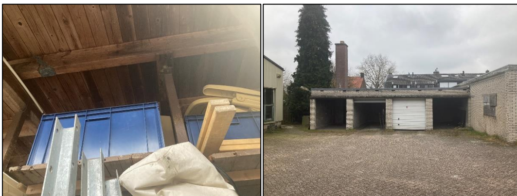
Figuur 2.7 (links): De binnenzijde van de opslag, het plafond is hier gemaakt van houten planken, met daarop een plat dak; Figuur 2.8 (rechts): De garageboxen, op de meer linker garagebox staat een schoorsteen.