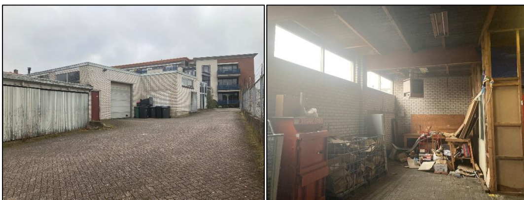
Figuur 2.5 (links): Een blik op het erf vanuit de noordzijde van het perceel. Hier is de opslag, een garagebox en de andere bebouwing te zien; Figuur 2.6 (rechts): De binnenkant van de grote garagebox.