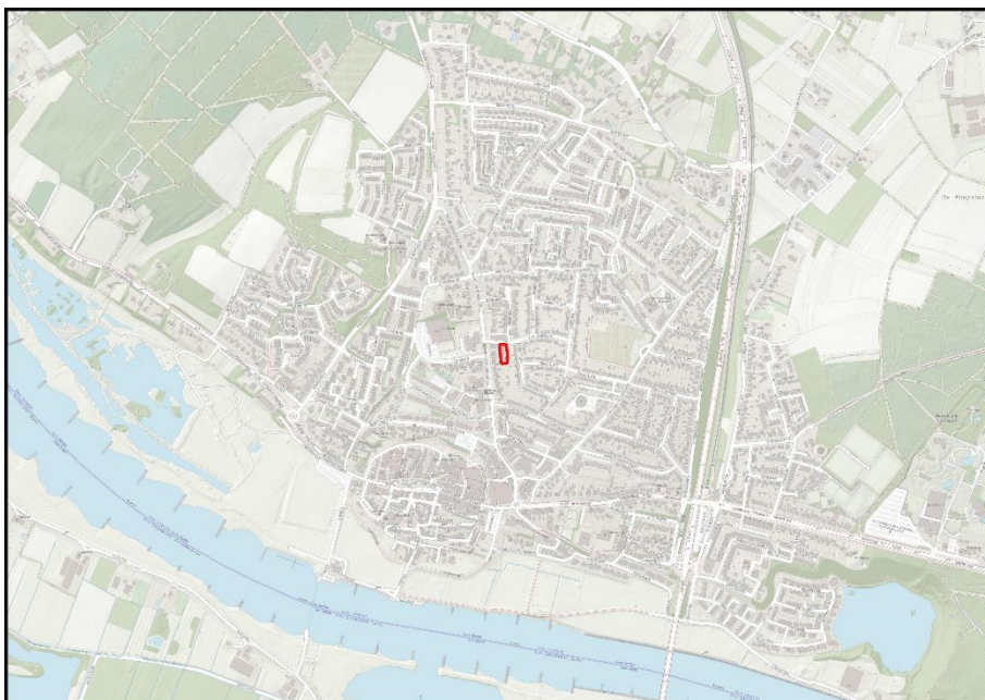
Figuur 2.1: Ligging van het plangebied.

Het plangebied (Figuur 2.1) bevindt zich aan de Populierenlaan 2, Rhenen. Het plangebied ligt in het centrum van Rhenen. De Nederrijn bevindt zich direct ten zuiden van Rhenen op ongeveer 900 meter van het plangebied. In het oosten ligt natuurgebied Utrechtse Heuvelrug en ten westen ligt de Grebbeberg, met daarnaast het gebied De blauwe kamer.