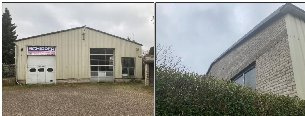
Figuur 2.11 (links): De voormalige garage bestaat uit damwand met een gemetselde onderkant. Het dak is opgebouwd uit houten panelen met daarbovenop golfplaat; Figuur 2.12 (rechts): De achterzijde van de garage bevat een aantal ramen. De muur is gemetseld en bevat geen stootvoegen.