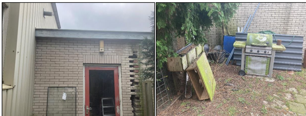
Figuur 2.15 (links): Aan de zuidzijde van de garage staat nog een kleine schuur. Op de erfgrans zitten kieren in de muur; Figuur 2.16 (rechts): Op een hoek op het erf staan oude materialen.