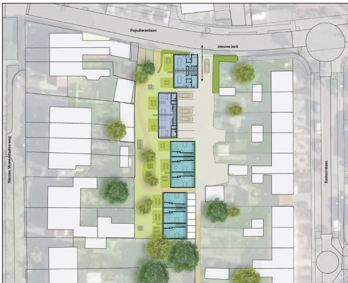
Figuur 2.17: Verbeelding van het wenselijk eindbeeld.

De volgende activiteiten worden getoetst op relevantie t.a.v. de Wet natuurbescherming: