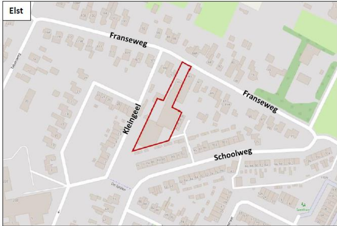
Figuur 1 De planlocatie (rood omkaderd) is gelegen aan de Franseweg 95 te Elst.