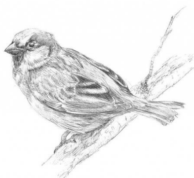
Tekening: Boet van Heugten

Boet van Heugten: Zijn oeuvre wordt gekenmerkt door een dusdanige diversiteit, dat het lijkt alsof het door verschillende kunstenaars gemaakt is. Toch valt er een rode draad in zijn werk te ontdekken: zijn schilderijen vallen op door hun heldere, frisse kleuren. Uniek zijn de steden van kathedralen, torens, gebouwen met koepels en moderne architectuur die, op de achtergrond van het schilderij, diepte geven aan de veelal abstracte afbeelding op de voorgrond. En regelmatig verschijnen er gestileerde dierfiguren, vaak vissen, op het linnen. Niet vreemd voor iemand die vroeger biologie gestudeerd heeft.