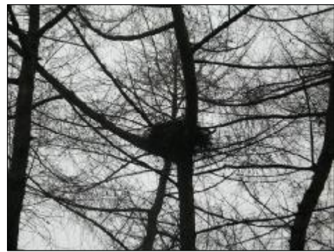
Foto's van het aangetroffen nest.