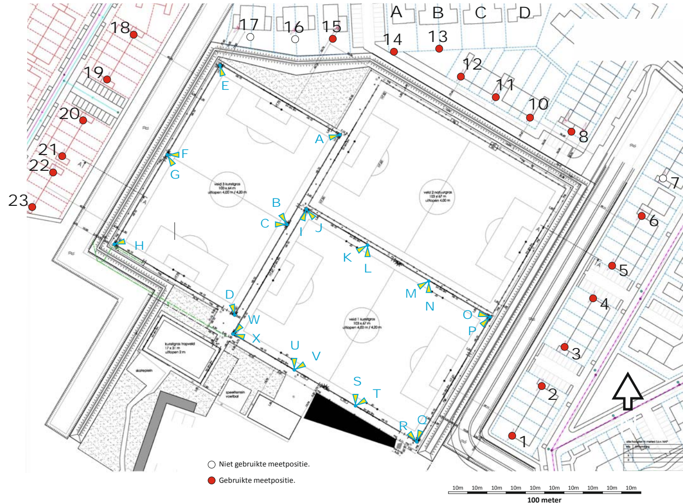
Plattegrond De Hokhorst Gegevens voor lichthindermetingen.

Het licht van de mastarmaturen werd vanuit enkele percelen uitsluitend afgeschermd door gas omheining.