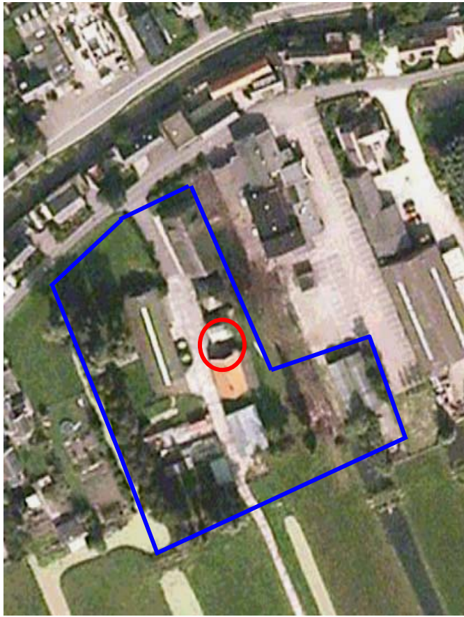
Afbeelding 1: Het onderzoeksgebied Locatie Cabauw, blauw omkaderd. Rood omcirkeld wordt aangegeven waar de verblijfplaats van de dwergvleermuis en grootorvleermuizen is aangetroffen.