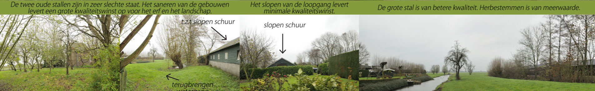
Goed beheer van boomgaard is kwaliteitswinst.