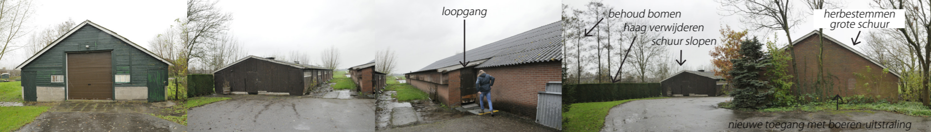
De twee oude stallen zijn in zeer slechte staat. Het saneren van de gebouwen levert een grote kwaliteitswinst op voor het erf en het landschap.