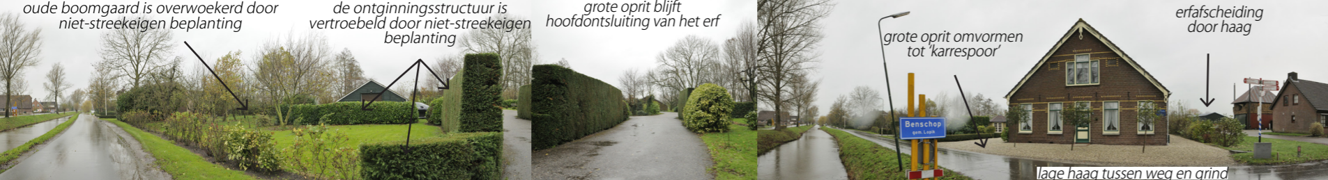
oude boomgaard is overwoekerd door niet-streekeigen beplanting