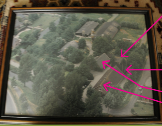
Luchtfoto van het erf.