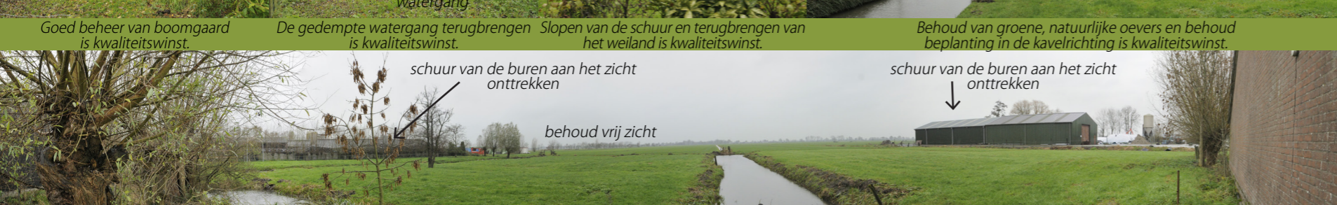
schuur van de burens aan het zicht onttrekken