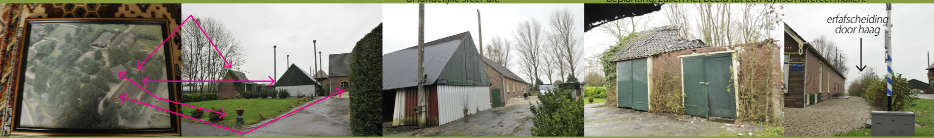
Grote oppervlakten grind zorgen voor een stenige uitstraling. Het toevoegen van beplanting, zullen het beeld tot een idyllisch tafereel maken.