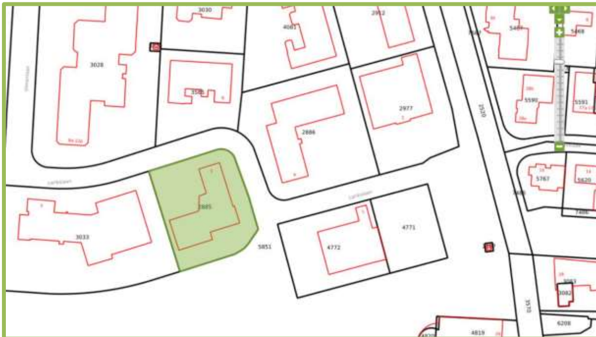
Planlocatie Larikslaan 3 Leusden

De planlocatie is gelegen op het industrieterrein "De Princenhof" te Leusden. Het betreft de Larikslaan 3 met kadastraal nummer Leusden 02 Sectie E 2885 groot 2.035 m 2 . Zoals doet vermoeden staat op het perceel een bedrijfsgebouw thans nog in gebruik als groothandel in monturen. Het gebouw is opgetrokken uit dubbel steens muren en gevelbeplating. Het dak is voorzien van bitumen en het hoogste gedeelte bitumen met grind. Verder zijn er in de gevels veel raampartijen en toegangs- / overheaddeuren. Rondom de bebouwing bestaat de planlocatie uit parkeerplaatsen en een gedeelte is ingericht als "tuin". Het pand bevindt zich nabij de kern van Leusden.