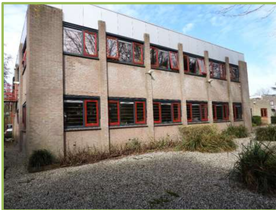
Gevels, raampartijen en gevelbeplating