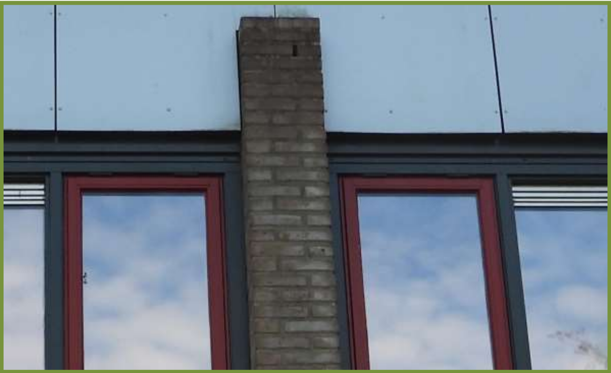
Voorbeeld van de open stootvoegen

Een gebied waar een vleermuis of een groep van vleermuizen foerageert.