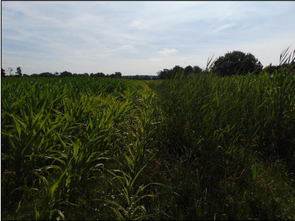
Figuur 1 Een van de twee percelen is gelegen ten oosten van de Maanweg en ten zuiden van de Groene Zoom en treft een maisveld. Op het maisveld zijn een aantal afwateringsslootjes gelegen die momenteel droog staan.