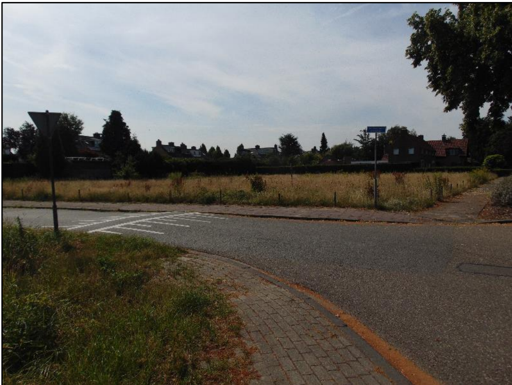
Figuur 2 Het perceel ten oosten van de Maandag betreft een braakliggend kavel, waarbij er sprake is van weinig onderhoud.