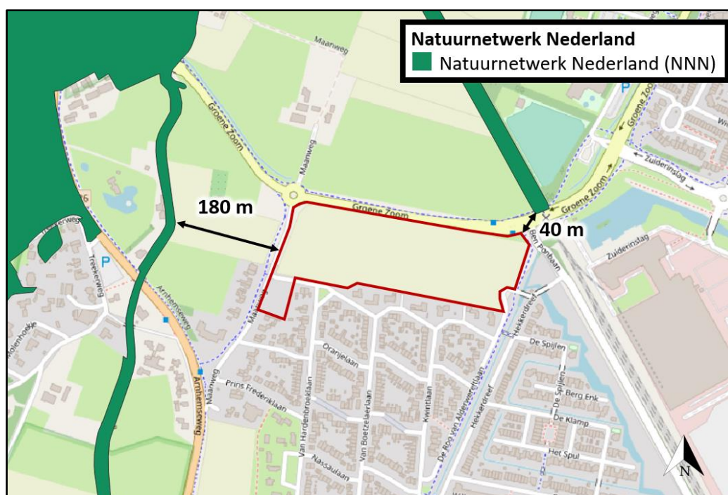
Figuur 3 Het plangebied (rood kader) ligt op 40 m afstand tot het Natuurnetwerk Nederland

De beoogde ontwikkeling betreft de realisatie van 120 nieuwbouwwoningen. De werkzaamheden gedurende de ontwikkeling kunnen leiden tot een tijdelijke toename in stikstofemissie (projecteffect). Daarnaast kan het gebruik van de woningen (m.n. uitstoot van NOx bij gebruik van gasketel) en de verkeersaantrekkende werking leiden tot een toename in stikstofemissie op de langere termijn. Een toename in stikstofdepositie kan een effect sorteren op kwetsbare en gevoelige habitattypen.