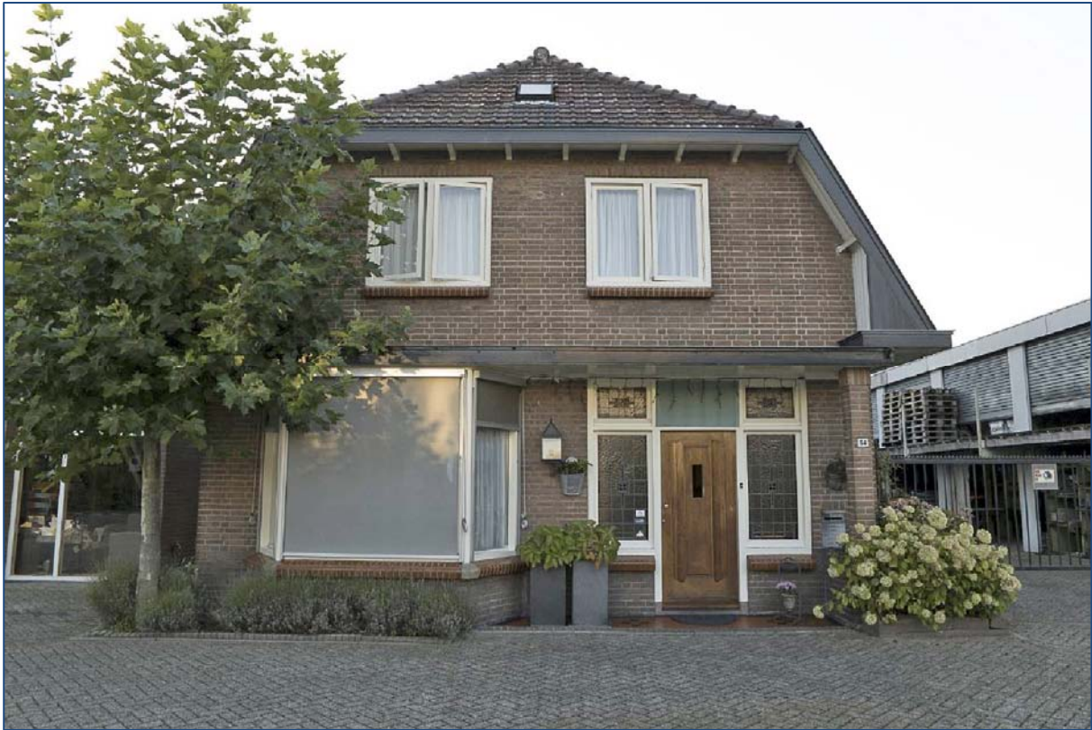
De voorzijde van het woonhuis op het perceel Hamersveldseweg 54

Bedrijfsgebouw Het bedrijfsgebouw bestaat uit een moderne winkel en opslagruimten. Het is een U-vormig gebouw dat aan de zuidzijde met het woonhuis is verbonden. De winkel omvat het zuidelijke deel van de U (gerekend vanaf het woonhuis), bestaat uit twee bouwlagen en heeft een breedte van circa tien meter. De opslagruimten beslaan het noordelijke deel van de U, ze bestaan uit één tot twee bouwlagen en zijn circa vijf meter diep.