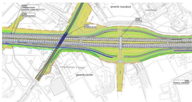
Afbeelding fragment deelgebied 5: reconstructie A28 Zuid

Het onderhavig bouwinitiatief heeft in die zin geen raakvlak met de reconstructie A28.