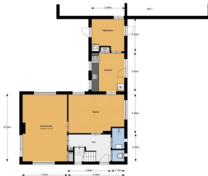
Beusichemweg 63, 1 Goy begane grond