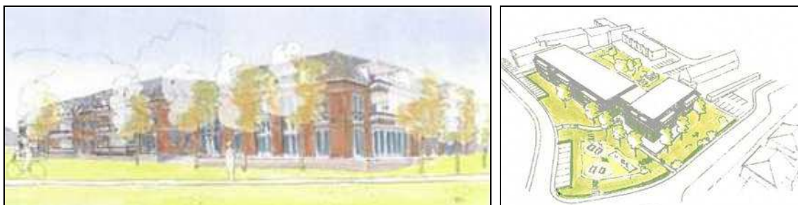
Figuur 3. Impressie van de plansituatie.

De plannen bestaan uit de sloop van de school, het bouwrijp maken van het terrein en de realisatie van appartementen (zie figuur 3). Parkeren dient op eigen terrein plaats te vinden.