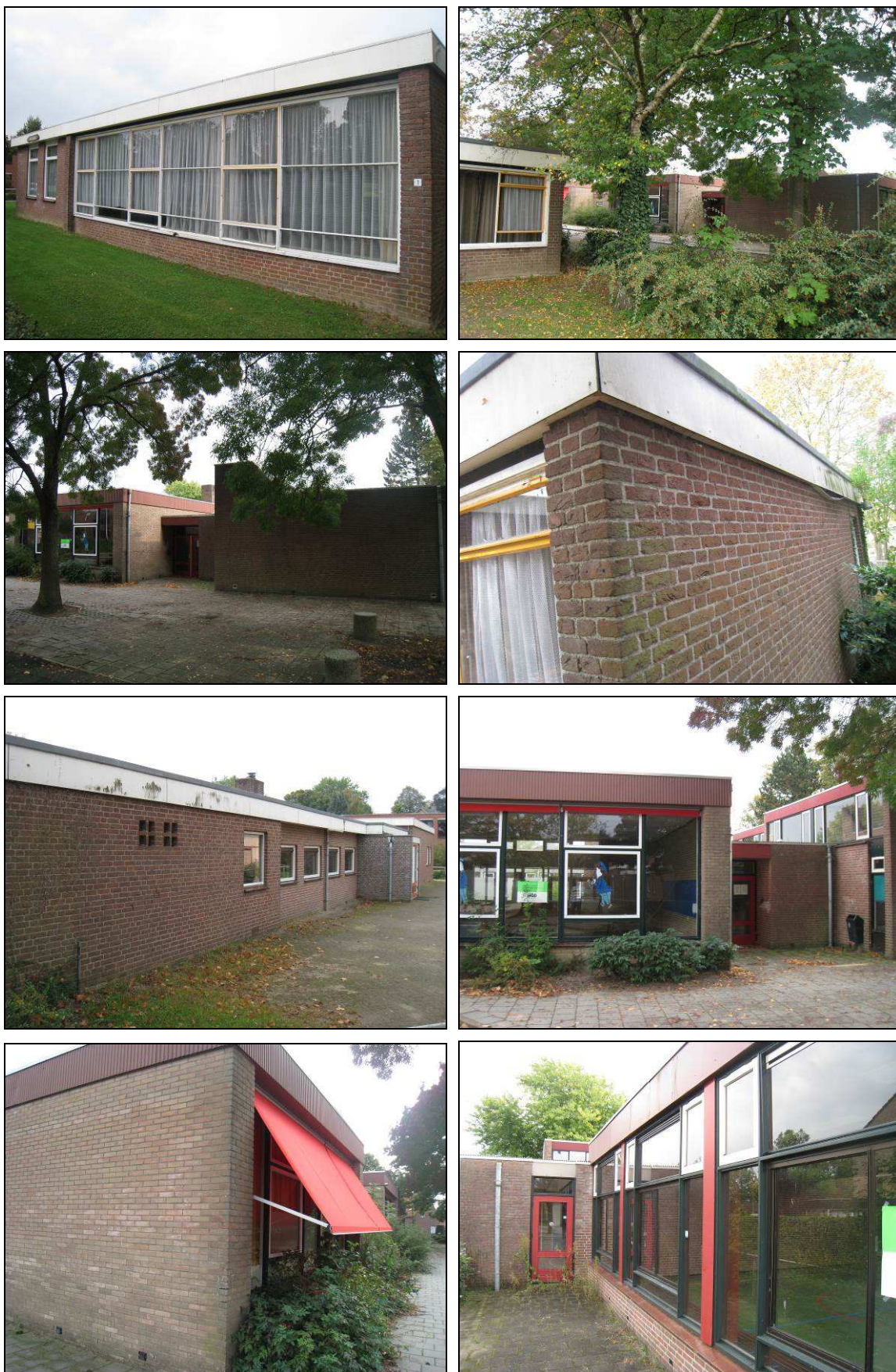
Figuur 2. Aanzicht van het het plangebied van de Bogermanschool te Houten (september 2014).