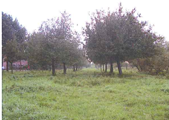
Figuur 1. De boomgaard op de locatie van fase 3.

Het deelgebied van Fase 3 bestaat uit weide grond met een oude boomgaard. Het westelijk deel van Fase 2 is een oude boerderij gelegen met een tweetal half open koeienstallen. Op het noordelijk deel ten westen van de Kerkeboerd is een woonhuis gelegen het zuidelijk deel bestaat uit een klein bosperceel.