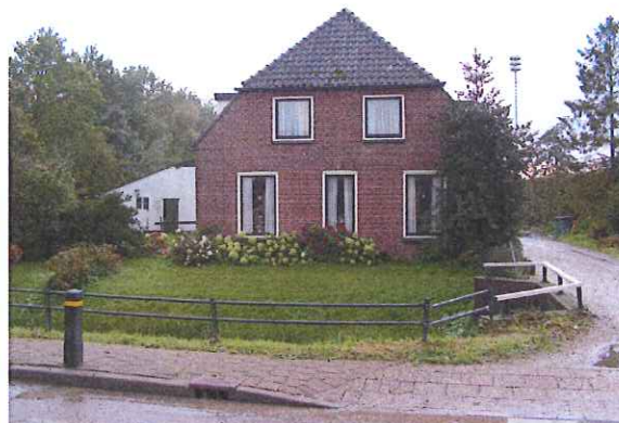
Figuur 2. Het woonhuis op het westelijk deel van fase 2.