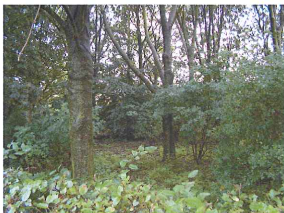
Figuur 3. Inkijk in het bosje.