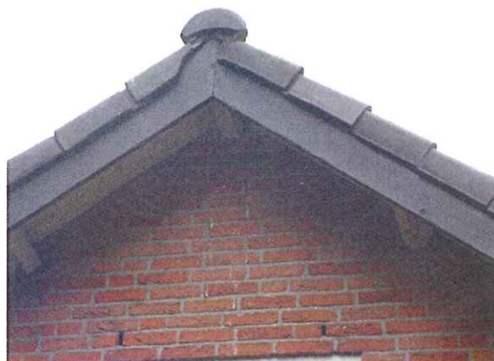
Figuur 4. Mestsporen onder de nok van het dak.