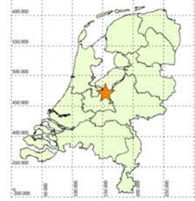
AFBEELDING 1 LIGGING PLANGEBIED

(ONDERGROND: TOPOGRAFISCHE KAART VAN NEDERLAND, SCHAAAL 1:25.000; TOPOGRAFISCHE DIENST KADASTER)