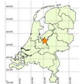
AFBEELDING 2 BOORPUNTENKAART (ONDERGROND: GBKN)