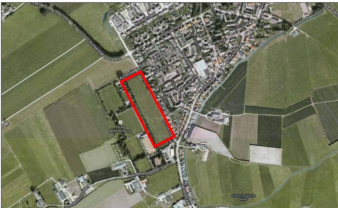
Figuur 1.1 Ligging plangebied

BAM Woningbouw heeft het voornemen om ten westen van Werkhoven 63 woningen te bouwen (zie Figuur 1.1). Het perceel wordt begrensd door de Achterdijk en sportcomplex 'Hoog Weerdenburg'. Doordat de planologische procedure weer opgestart wordt, dient het akoestisch onderzoek uit februari 2010 geactualiseerd te worden.