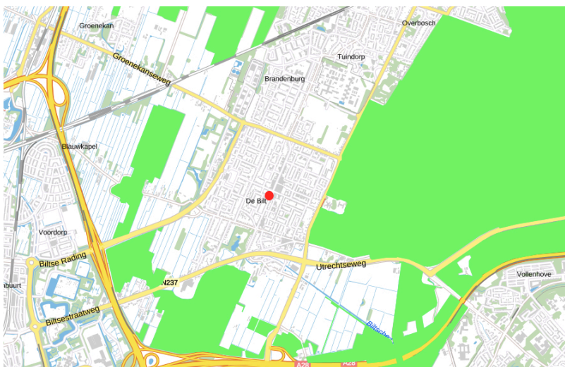
Afbeelding 4. Locatie plangebied (rood). NNN (groen)

De planlocatie ligt niet binnen de begrenzing van het Natuurnetwerk Nederland. De dichtstbijzijnde gebieden betreft de Utrechtse Heuvelrug op circa 500 meter ten oosten van de planlocatie. De ingrepen vinden plaats buiten deze provinciaal beschermde gebieden en hebben geen effect op de kernkwaliteiten en ontwikkelingsdoelen. Nader onderzoek naar externe effecten is niet nodig.