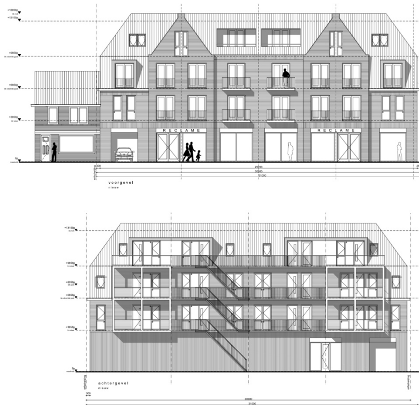
Afb. 2. Voorgenomen werkzaamheden. De toekomstige situatie