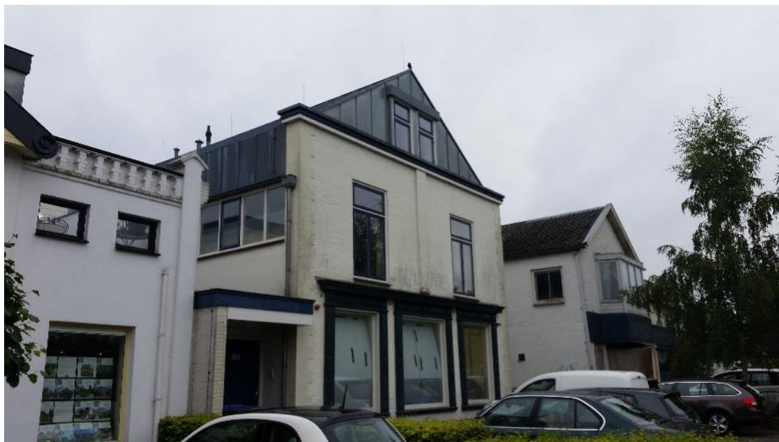
Figuur 2. Voorkant van voorste gedeelte van het pand grenzend aan de Eemnesserweg. In dit gedeelte zijn geen functies van beschermde soorten aanwezig.