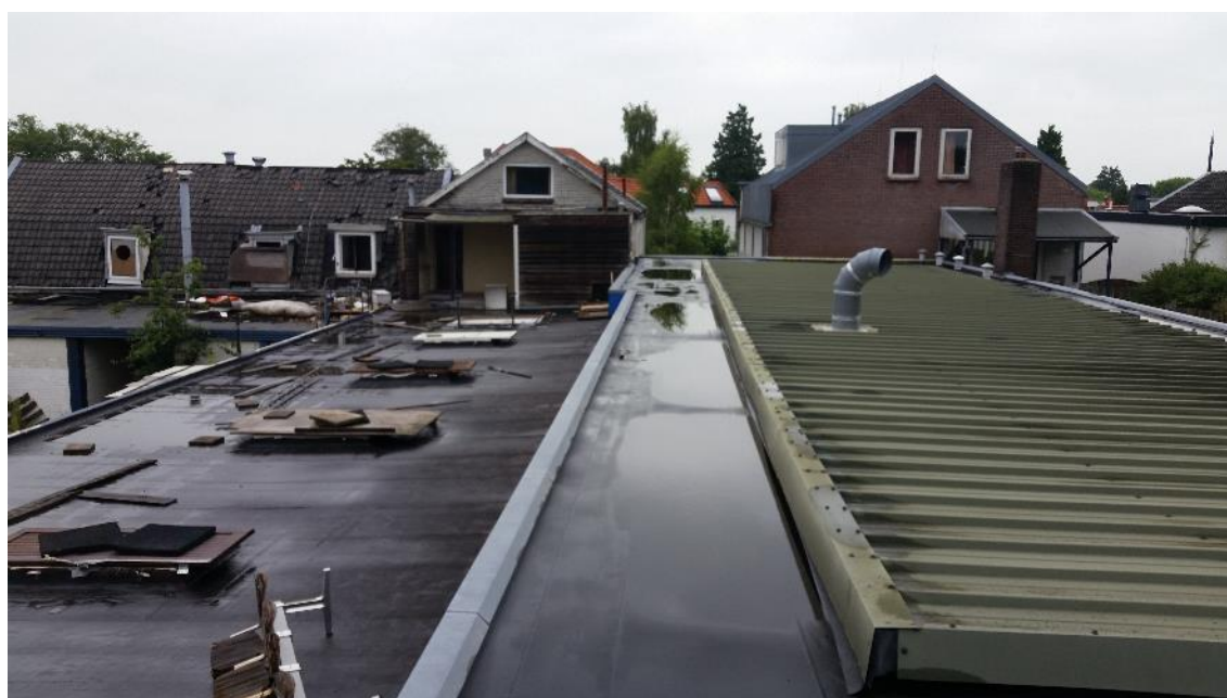
Figuur 7. Pand van bovenaf gezien. Het platte dak met bitumen dakbedekking.