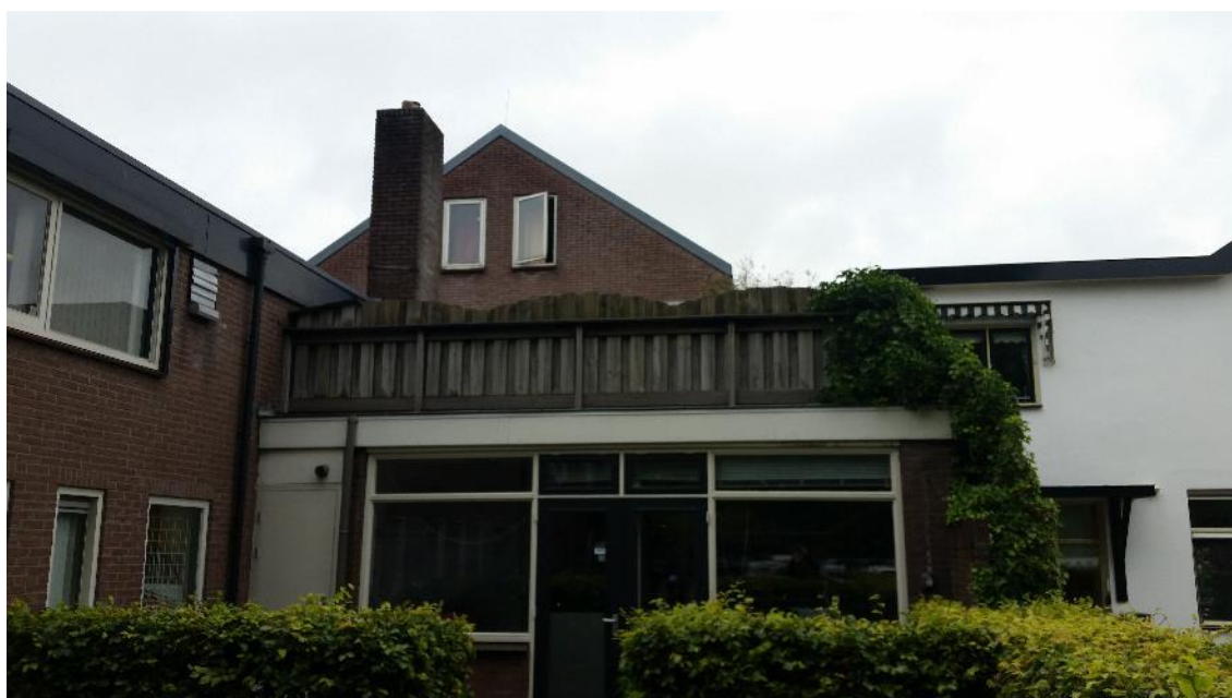
Figuur 3. Achterkant van het voorste deel is zichtbaar, ook het achterste deel is zichtbaar met plat dak.