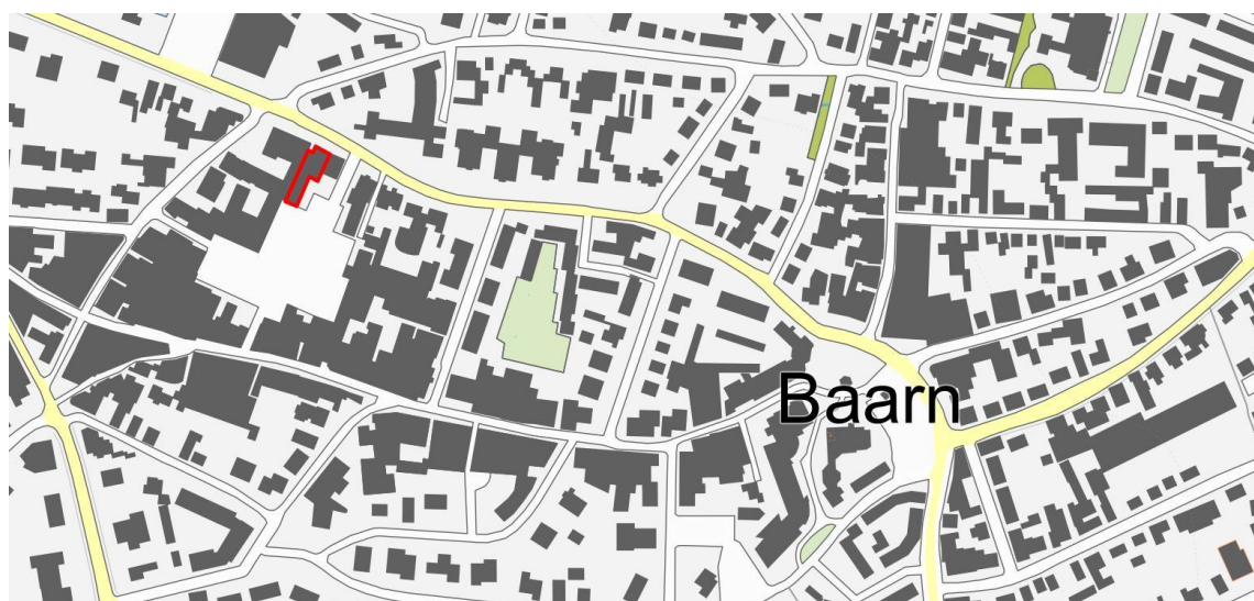
Figuur 1, Ligging van het plangebied, met de begrenzing in rood aangegeven. © Dienst voor het kadaster en de openbare registers, Apeldoorn, 2017.

Het plangebied betreft een pand aan de Eemnesserweg 57 gelegen in Baarn, in de provincie Utrecht. In Figuur 1 is de begrenzing van het plangebied weergegeven. Het plangebied wordt aan de zuidzijde begrensd door een parkeerplaats aan de achterkant van het gebouw, aan de westzijde door bebouwing aan de Nieuwstraat, aan de noordzijde door de Eemnesserweg, en aan de oostzijde door een toegangsweg naar de parkeerplaats.