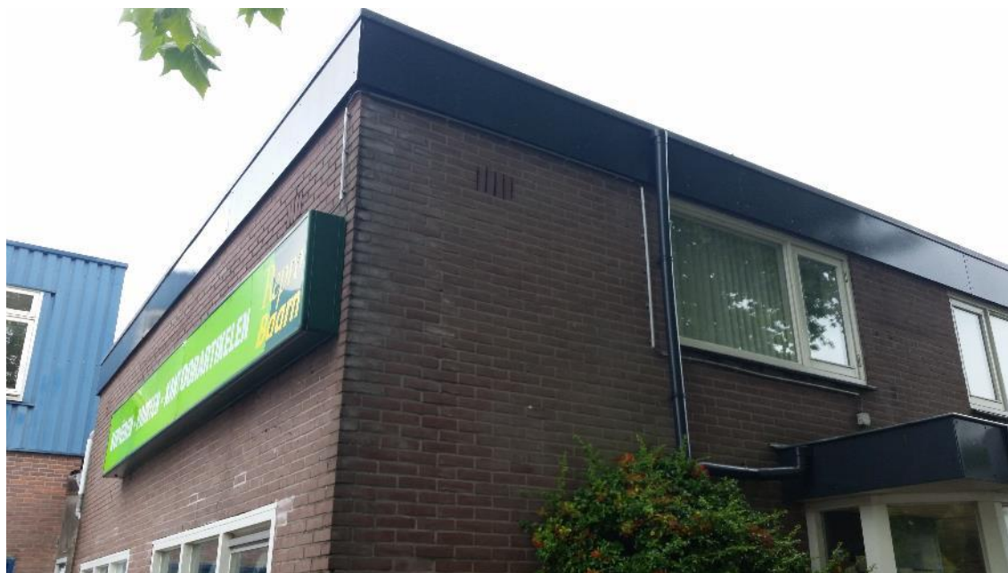
Figuur 6. Achterste gedeelte van het pand met plat dak. De stootvoegen op de hoek zijn goed zichtbaar. In de spouwmuur en achter de boeiboorden kunnen vleermuizen zitten.