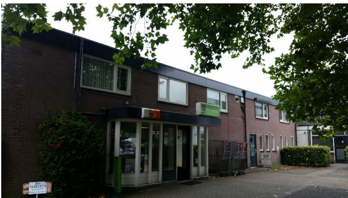
Figuur 5. Achterste gedeelte van het pand, met plat dak.