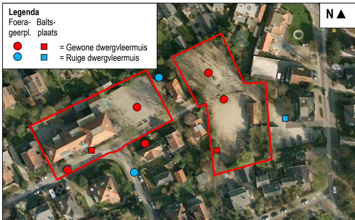
Figuur 3. Waarnemingen van vleermuizen in de voorherfst van 2015 ter plaatse van en direct rond het plangebied aan de Smutslaan te Baarn.