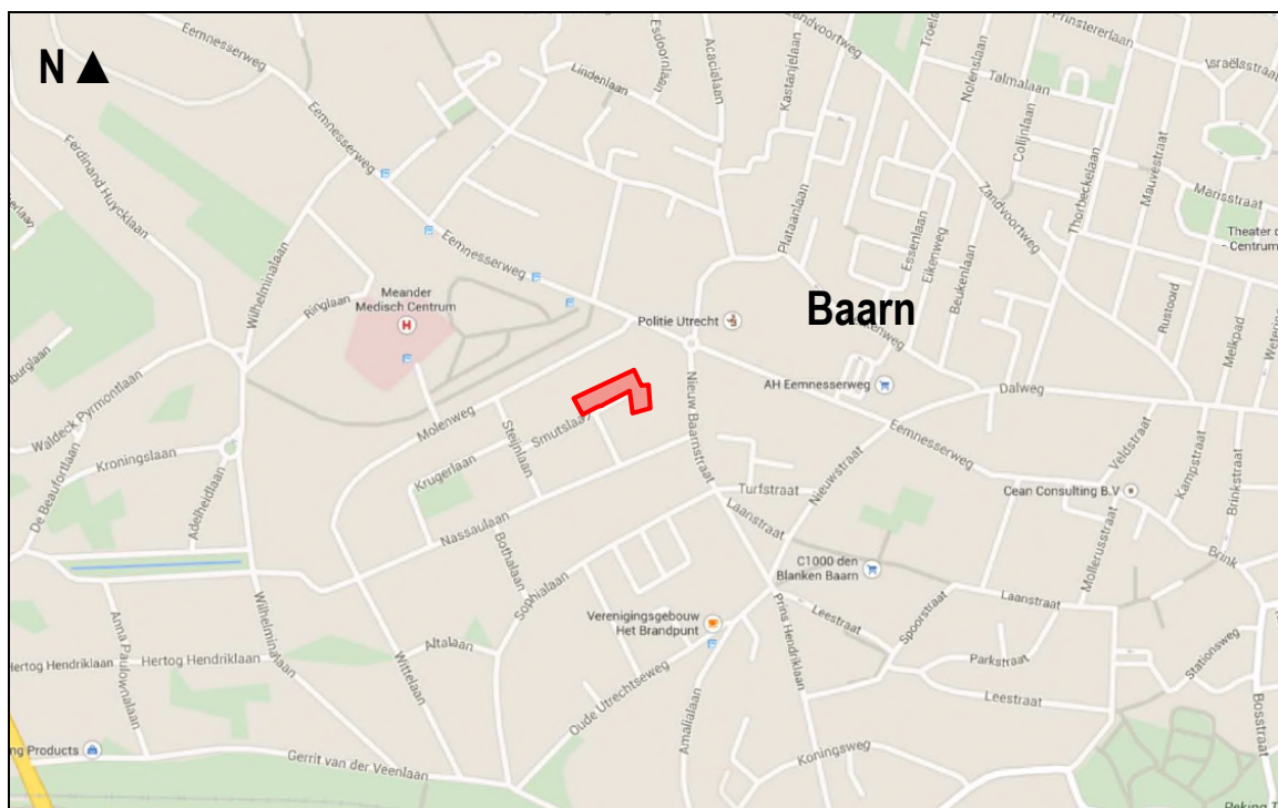
Figuur 1. Globale ligging van het plangebied Buitengewoon Baarn aan de Smutslaan te Baarn.

Het plangebied is gelegen aan de Smutslaan te Baarn. Voor een omschrijving van dit gebied wordt verwezen naar het verkennend onderzoek (Adviesbureau Mertens, 2015).