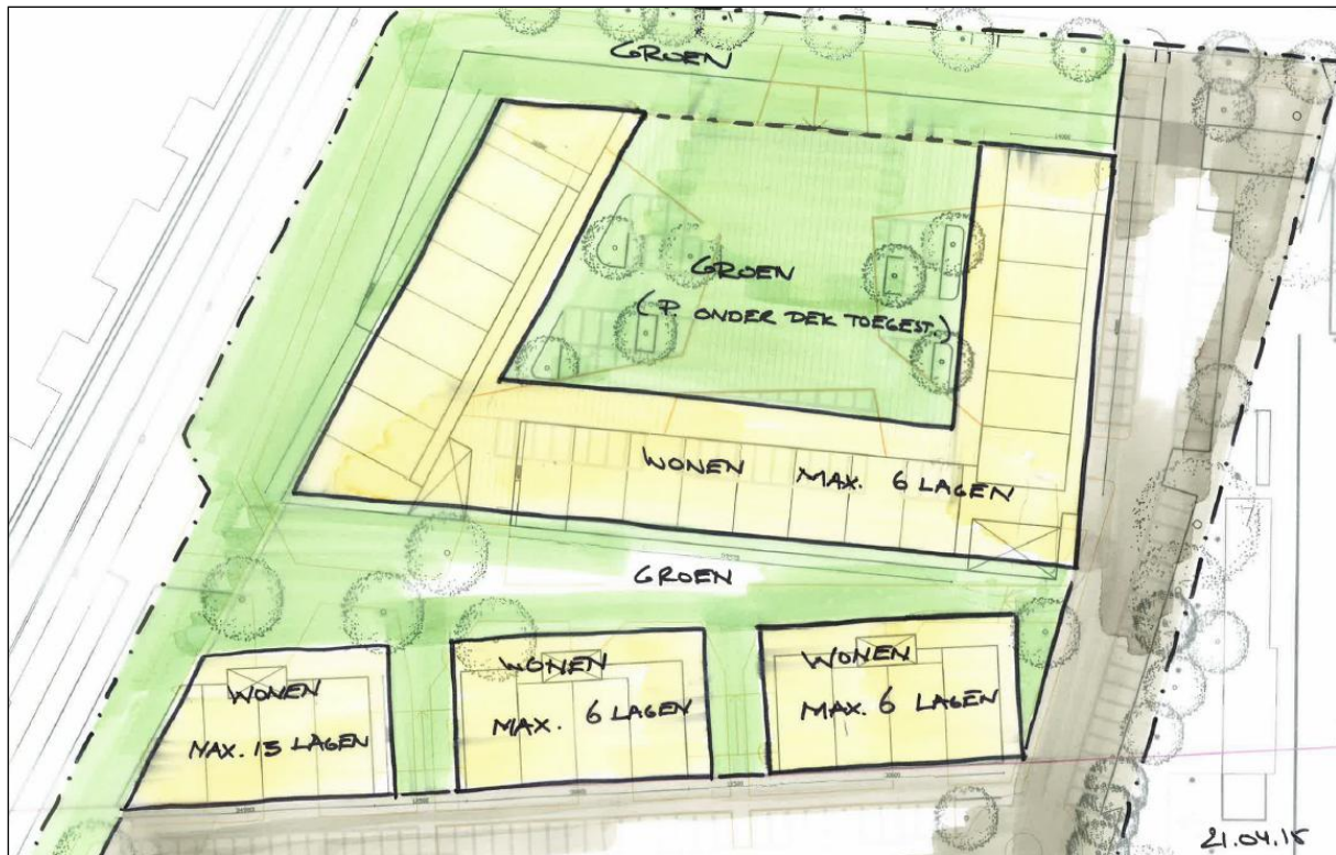
Figuur 2: Indeling Keerkring 5

Momenteel wordt uitgegaan van maximaal 200 woningen zoals aangegeven in onderstaande figuur.