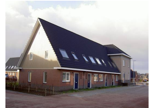
Materiaal en kleurgebruik