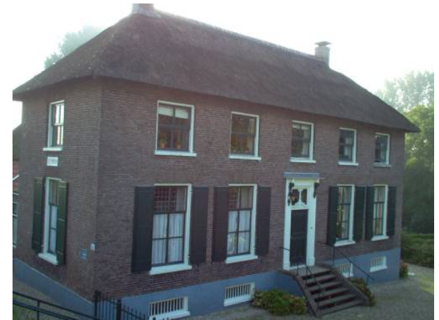
Referentie gevel hoofdgebouw