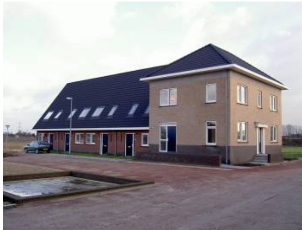
Nieuw wooncluster "boerderij-appartementen"