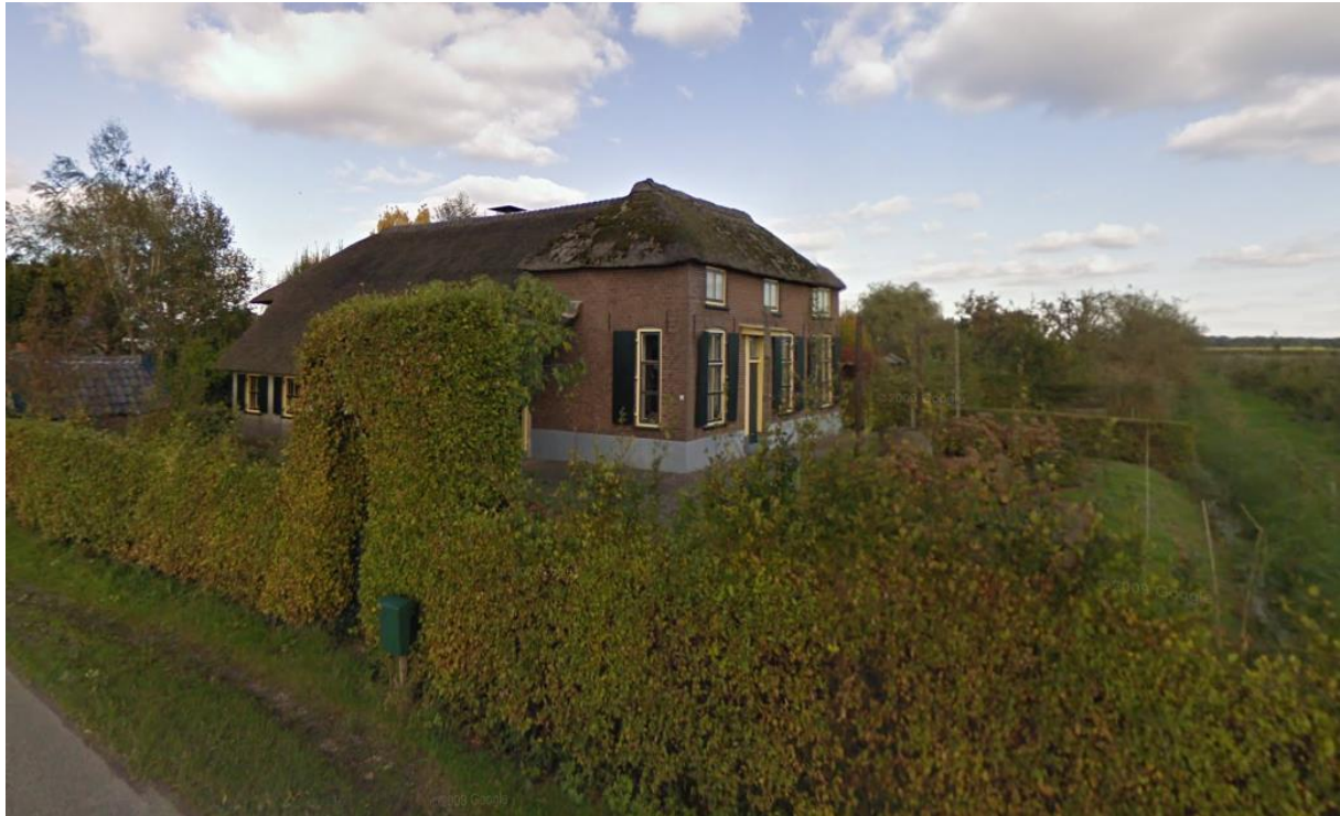
Afbeelding 2: Aanzicht vanaf de Uilenburgsestraat