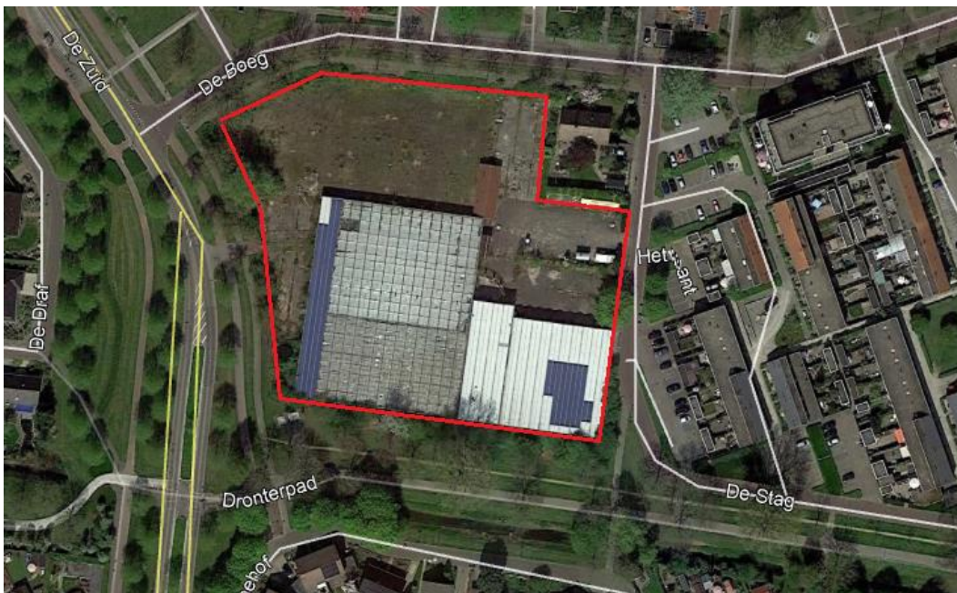
Figuur 1.1-1: Globale ligging plangebied (rode pijl)

Voor het perceel van het voormalig tuincentrum De Boeg in Dronten bestaan herontwikkelingsplannen. Op het terrein worden nieuwe woningen gebouwd. In 2017 heeft reeds een verkennend natuuronderzoek plaatsgevonden. Omdat de bebouwing en verharding op het terrein inmiddels is verwijderd, is het natuuronderzoek geactualiseerd. Voorliggend rapport bevat de uitkomsten van de actualisatie van het verkennend natuuronderzoek.