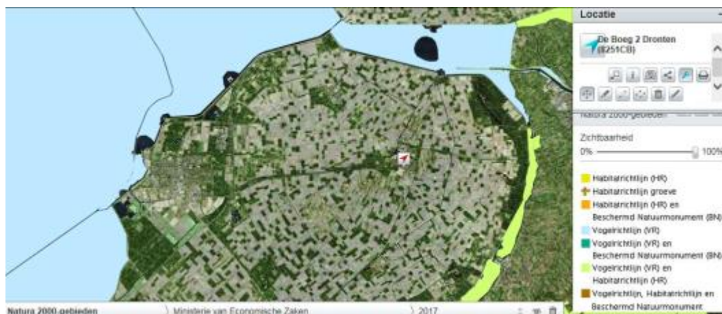
Figuur 3.1: Ligging Natura 2000-gebieden ten opzichte van het plangebied (rode pijl).

Het plangebied maakt geen onderdeel uit van de begrenzing van een Natura 2000-gebied. Het dichtstbijzijnde Natura 2000-gebied is Ketelmeer & Vossemeer op ca. 7 km afstand van het plangebied. Op ca. 9 km afstand van het plangebied ligt het Natura 2000-gebied Veluwerandmeren. Andere Natura 2000-gebieden liggen op grotere afstand (> 15 km) van het plangebied.