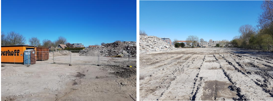
Figuur 1.1-2: Indruk plangebied.