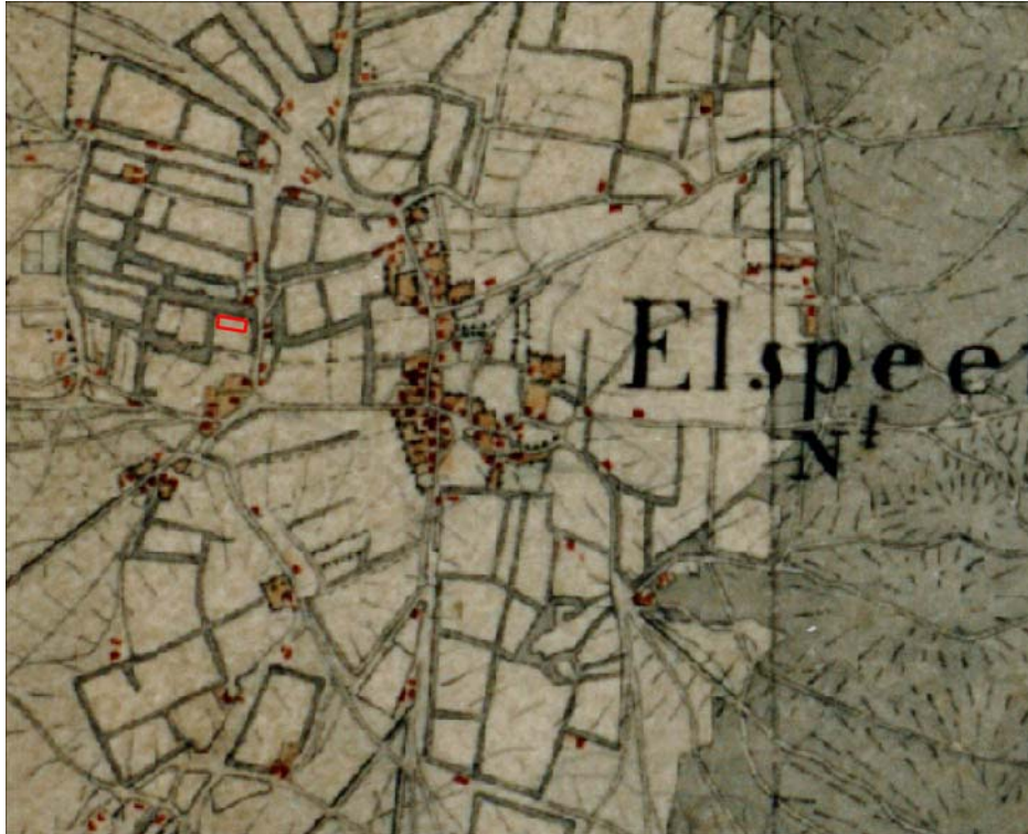
Topografische Militaire Kaart (TMK) 1850). In rood is het plangebied aangegeven.

Binnen een straal van 600 meter ligt een tiental andere archeologische waarnemingen. Deze waarnemingen (tijdens werkzaamheden gedaan en gemeld) bestaan uit prehistorische bijlen, grafkuilen en aardewerk. Het moge duidelijk zijn dat op de flank van de Veluwe veel resten uit de prehistorie te verwachten zijn.