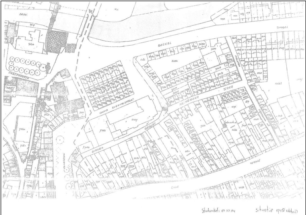
De situatie rondom de Halvemaanstraat en Melatensteeg in 1948. Kleinschalige bebouwing direct aan de straat. De Halvemaanstraat sluit aan op een bruggetje over de Binnengracht.