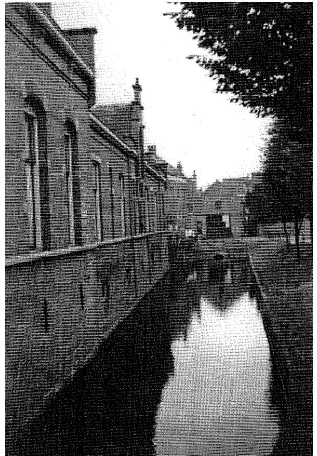
De Binnengracht met Ruitershofje in de richting van de Halvemaanstraat. Het bruggetje is reeds vervangen door een dam met duiker. Foto uit 1956.