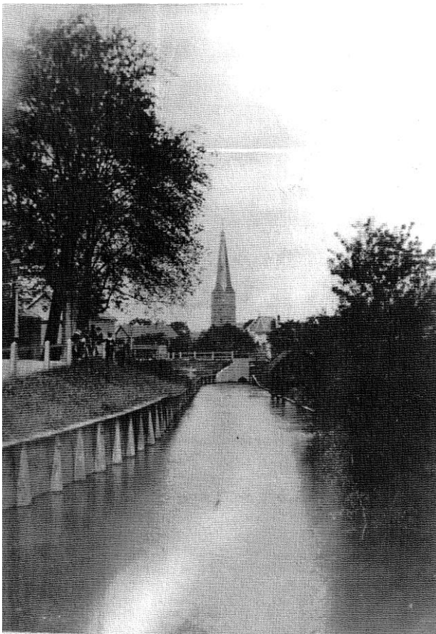
De Binnengracht vanaf het bruggetje in de Halvemaanstraat richting de inlaatstuw van de Berkel uit 1885. Het Ruitershofje werd in 1898 opgeleverd.

Bij de restauratie van de inlaatstuw zijn stuw en gracht weer beleefbaar gemaakt door reconstructie van enkele meters gracht watervoerend te maken.