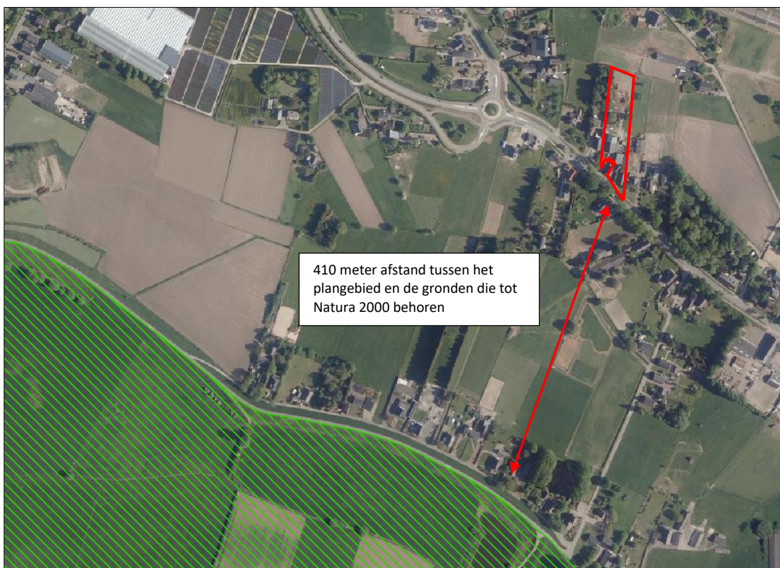
Ligging van Natura 2000-gebied in de omgeving van het plangebied. De ligging van het plangebied wordt met de rode lijn aangeduid. Gronden die tot Natura 2000 behoren worden met de groene arcering aangeduid.

Het plangebied ligt op minimaal 410 meter afstand van Natura 2000-gebied. Het meest nabij gelegen Natura 2000-gebied, is Rijntakken. Op onderstaande afbeelding wordt de ligging van het Natura 2000-gebied in de omgeving van het plangebied weergegeven.