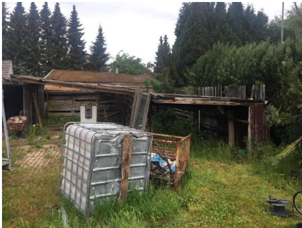
Amfibieën kunnen een (winter)rustplaats bezetten onder rommel en puin.

Tijdens het veldbezoek zijn geen amfibieën waargenomen, maar gelet op de inrichting en het gevoerde beheer, wordt het plangebied als functioneel leefgebied voor sommige algemene en weinig kritische amfibieënsoorten beschouwd. Amfibieën als bruine kikker en gewone pad benutten het plangebied als foerageergebied en mogelijk bezetten ze er een (winter)rustplaats. Deze soorten kunnen een (winter)rustplaats bezetten in holen en gaten in de grond, onder strooisel en bladeren en onder opgeslagen spullen en/of rommel, zowel in gebouwen als in de buitenruimte. Het plangebied wordt niet als functioneel leefgebied van zeldzame amfibieënsoorten als kamsalamander, rugstreepad of poelkikker beschouwd. Geschikt voortplantingsbiotoop ontbreekt in het plangebied.