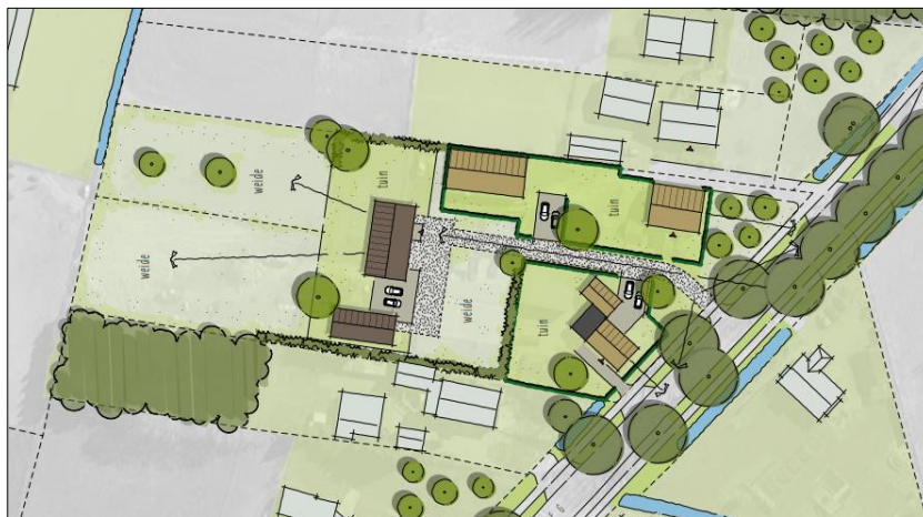
Plattegrond van het wenselijk eindbeeld, begrenzing wordt met de rode lijn aangeduid

De volgende activiteiten worden getoetst op relevantie t.a.v. de Wet natuurbescherming: