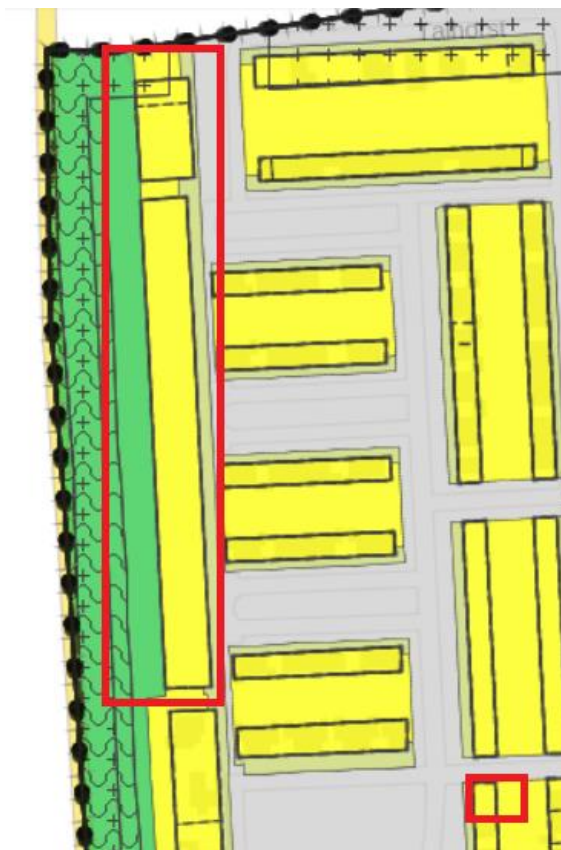
Uitsnede bestemmingsplan 'Tolkamer' met globale aanduiding plangebied in rood

Voor het plangebied geldt het bestemmingsplan 'Tolkamer', dat door de gemeenteraad van de gemeente Rijnwaarden is vastgesteld op 5 november 2013. Onderstaande afbeelding toont een uitsnede van het bestemmingsplan met een globale aanduiding van het plangebied.