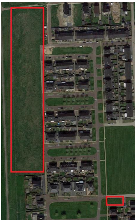
Luchtfoto met globale aanduiding plangebied

Onderstaande afbeelding toont de globale ligging van beide delen van het plangebied. Voor de exacte begrenzing wordt verwezen naar de verbeelding, behorende bij dit bestemmingsplan.