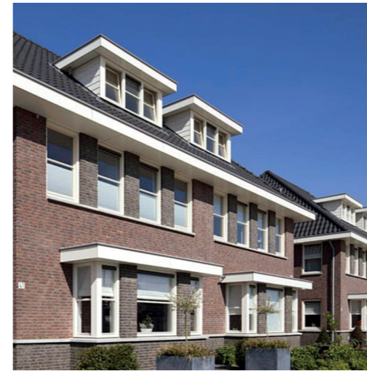
Dorpse/ boerse uitstraling. Verlangen naar beschutting en intimiteit uitstralende gebouwen.