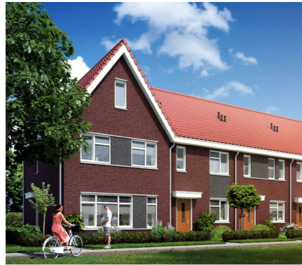
Doorlopende gootlijn, entree verbijzonderen. Horizontale belijningen in de dakgoten en kozijnen, hellend dak en langwerpige ramen.

Uitvoering kan middels hekwerk met hедера uitgevoerd worden of door een haagbeuk.