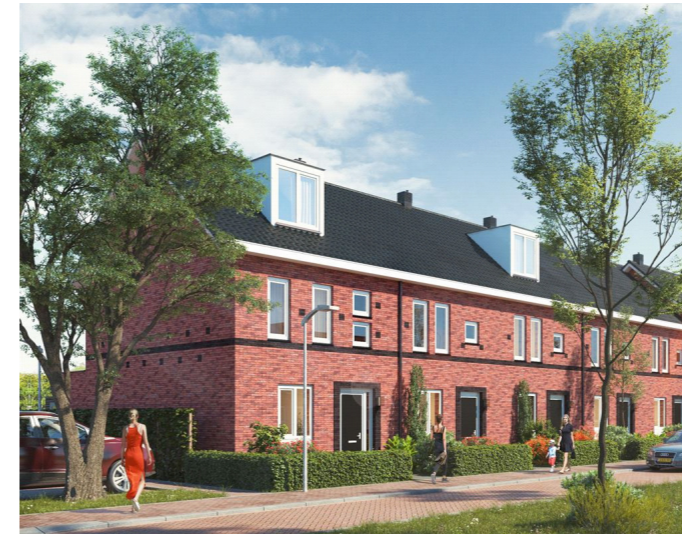
Samenhang tussen woningen met toepassing van natuurlijke en natuureigen materialen. Meerkappers worden als ensemble vormgegeven met aandacht voor de opbouw.