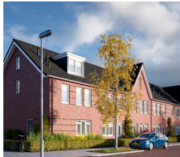
Forse kappen afgedekt met natuurlijke materialen en altijd voorzien van een nok.