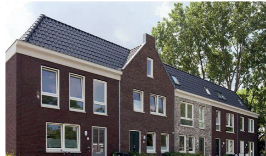
Accentwoning doorbreekt de bloklengte. De gevels ogen rustig en bescheiden, met warme aardkleuren.