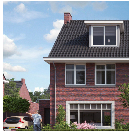
Landelijk en vriendelijk karakter met duidelijk karakteristieke elementen.