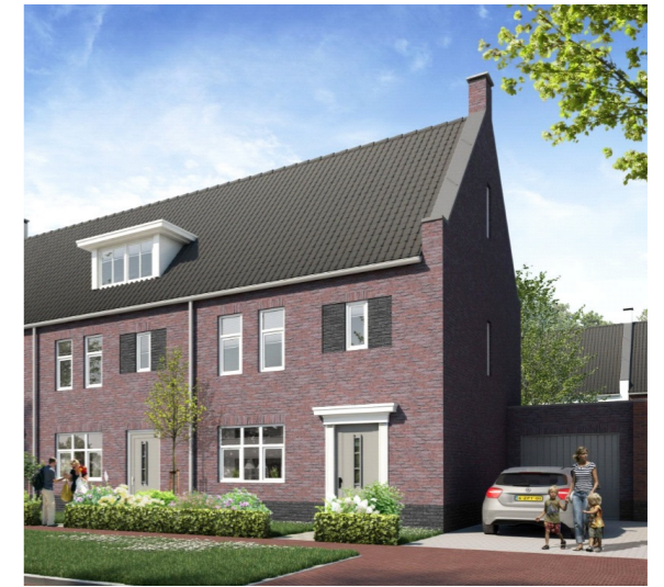
Gebruikmakend van staande kozijnen. Daarnaast worden de overgangen van kap naar gevel (goot) zorgvuldig gedetailleerd.