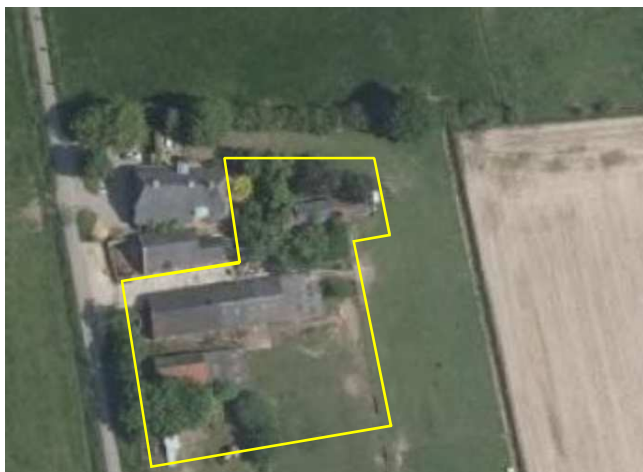
Detailopname van het plangebied.

Het plangebied bestaat uit een deel van een voormalig agrarisch erf. Op het erf staan, behalve een vrijstaande woonboerderij en een eraan vast gebouwde schuur, enkele oude (gedeeltelijk) vervallen stallen. Dit betreffen drie houten en één stenen stal. De houten stallen zijn gedekt met gebakken pannen, de stenen stal is gedekt met golfplaten. Alleen de stenen stal beschikt over dakisolatie in de vorm van hardschuimen isolatiepanelen. Rondom de gebouwen ligt grasland; tijdens het veldbezoek in gebruik als schapenweide. Verspreid in het plangebied staan enkele hoogstam fruitbomen en enkele loofbomen. Het plangebied grenst aan de westzijde aan de Kerkedijk en aan de overige zijden aan agrarisch cultuurland. Op onderstaande afbeelding wordt het plangebied in detail weergegeven.