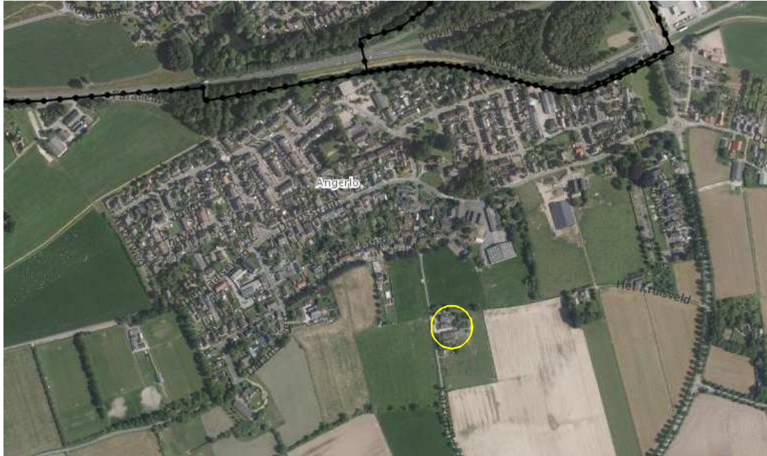
Globale ligging van het plangebied in de omgeving. Het plangebied wordt met de gele cirkel aangeduid.

Het plangebied is gelegen op het adres Kerkedijk 3 in Angerlo. Het ligt in het buitengebied, circa 300 meter ten zuiden van Angerlo. Op onderstaande afbeelding wordt de globale ligging van het plangebied weergegeven.