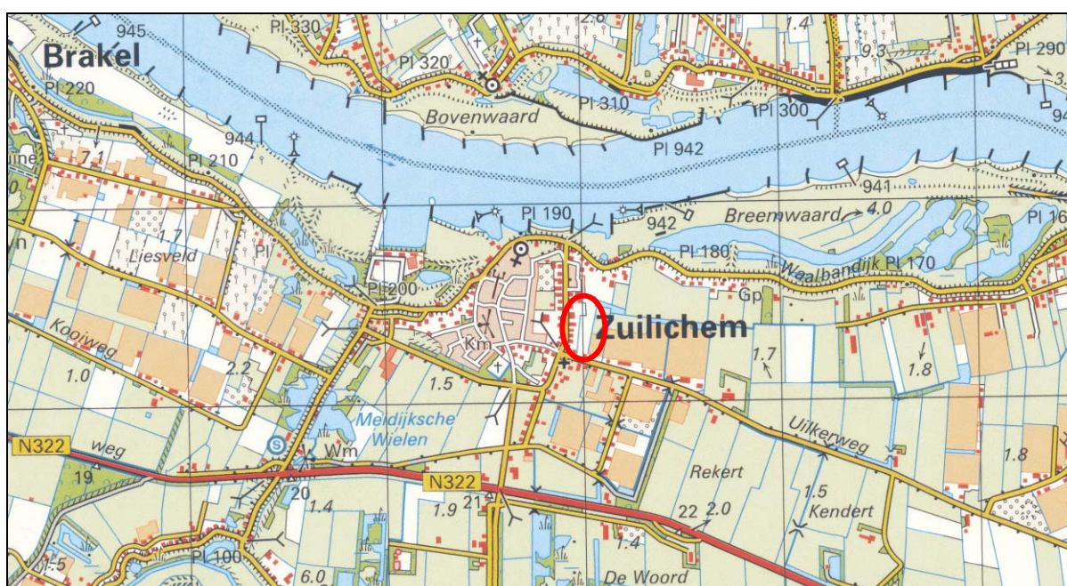
Figuur 1. Globale ligging van Dijkzicht-Zuid te Zuilichem.

Momenteel wordt er gewerkt aan het woningbouwproject Dijkzicht-Zuid te Zuilichem in de gemeente Zaltbommel. Voor dit gebied is een natuurwaardeninventarisatie uitgevoerd (Bureau Schenkeveld, 2009). Uit dit onderzoek komt naar voren dat aanvullend onderzoek gewenst is naar het voorkomen van de zwaar beschermde rugstreep. Op grond hiervan heeft de gemeente Zaltbommel aan Adviesbureau Mertens BV te Wageningen gevraagd om een veldinventarisatie uit te voeren naar het voorkomen van de rugstreep. In dit rapport worden de resultaten van deze inventarisatie gepresenteerd.